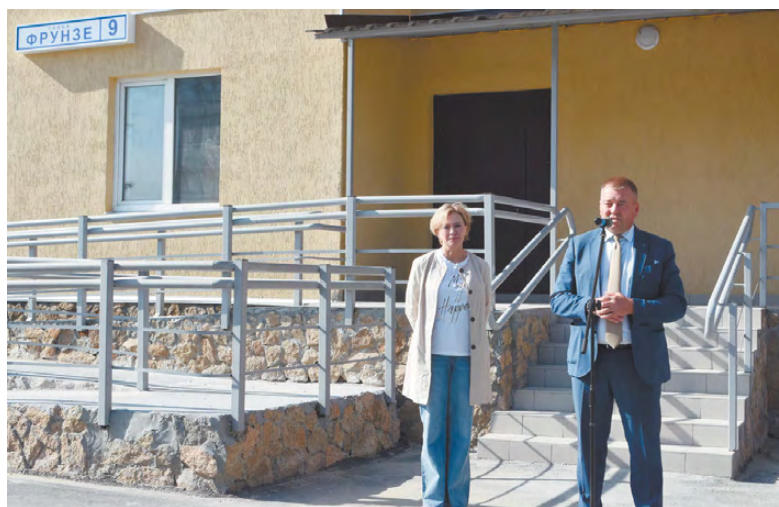
Глава РГО и директор ФЖС поздравили новосёлов.

Новосёлы поблагодарили застройщика, Фонд жилищного строительства и всех, кто приложил усилия для реализации существующей социальной про-