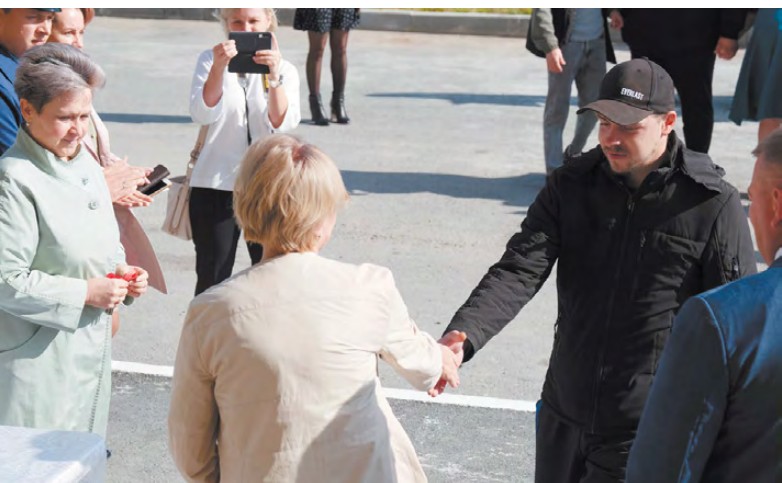
Торжественное вручение ключей под аплодисменты гостей.

Отметим, что с начала текущего года Фонд жилищного строительства предоставил детям-сиротам 510 квартир в различных муниципалитетах нашего региона, включая Реж. Такая весомая мера государственной поддержки, с одной стороны, позволяет обеспечить уральцев доступным жильём, с другой – простимулировать строительство домов в регионе для достижения целей национального проекта «Жильё и городская среда».