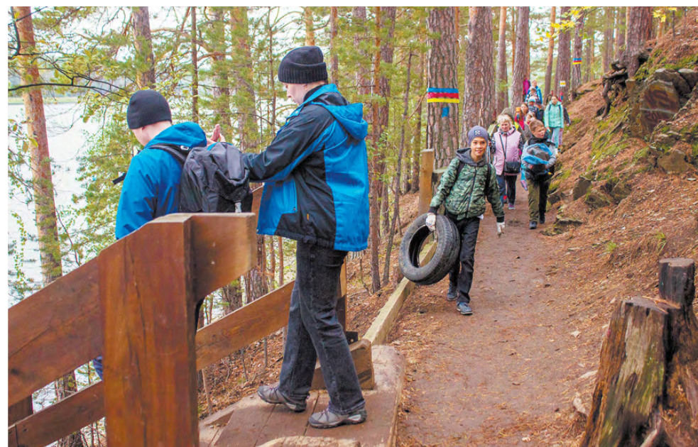
Во время прогулки по традиции прошла акция «Чистый лес»: туристы собирали встречающийся на тропе мусор.