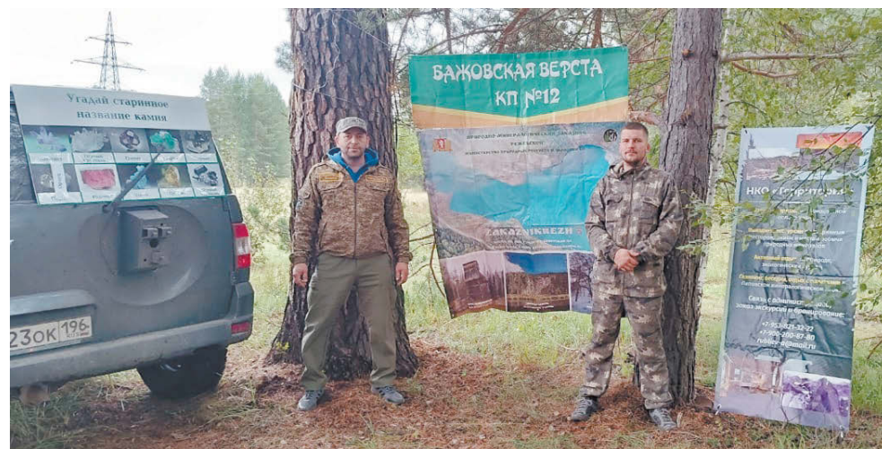
Контрольный пункт минералогического заказника «Режевской».

Для участников и зрителей «Бажовской версты» также прошли ярмарка сысертских мастеров и кулинарный мастер-класс. Финишировавшие смогли не только посмотреть на приготовление блюда из