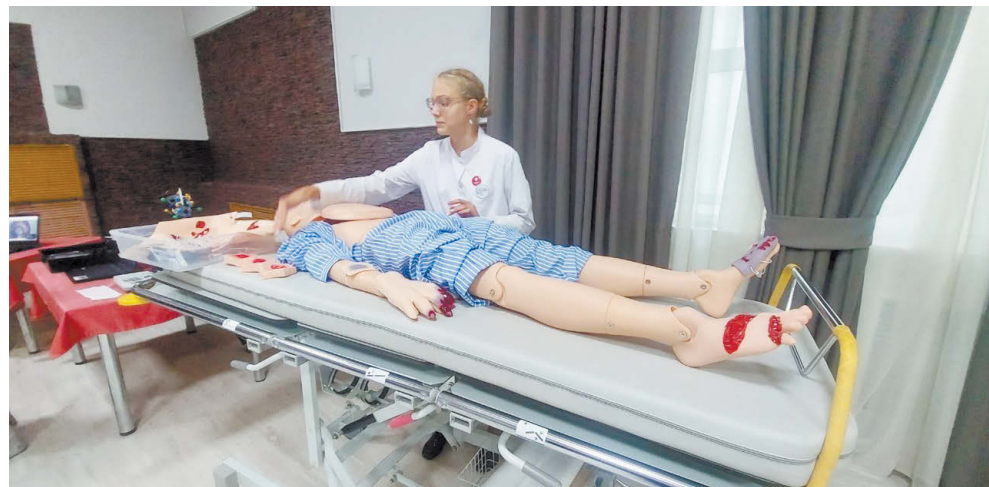
Такие интерактивные манекены будут использоваться в процессе специализированного обучения.