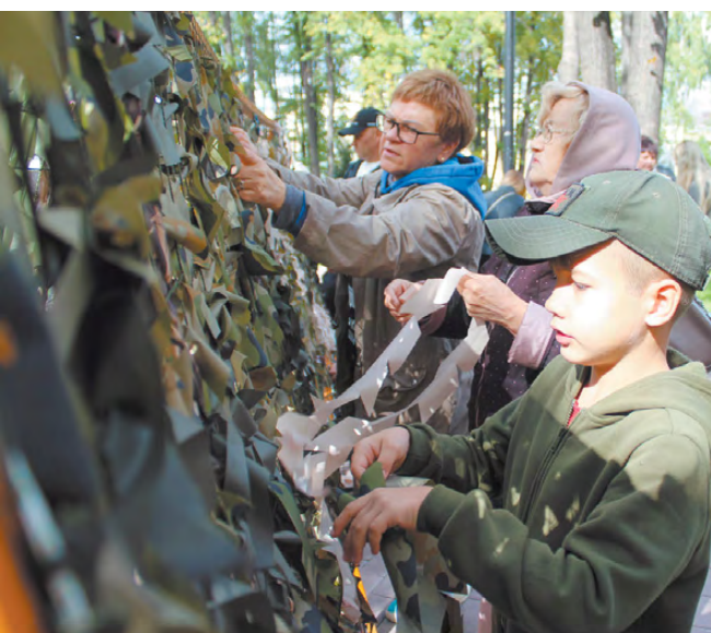
В плетении сетей приняли участие как опытные мастера, так и новички.

Зрители и выступающие стали в этот день единым целым, а звучавшие со сцены песни воспринимались как призыв, вызывая слезы. Двухчасовой концерт, прошедший под названием «Своих не бросаем», неоднократно прерывался шквалом аплодисментов. Собравшиеся на акцию режевляне выразили глубокое уважение и признательность нашим воинам за их самоотверженность и героизм!