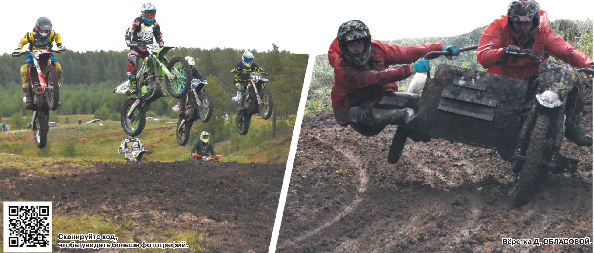
Вёрстка Д. ОБЛАСОВОЙ.

Борясь за победу, спортсмены не осторожничали. Покоряли тяжелые подъемы, выбирались из глубокой колеи, приезжали на финиш, с головы до ног покрытые грязью. Спасибо им за зрелищные гонки, которые подарили зрителям массу положительных эмоций!