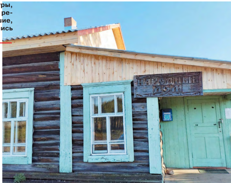
Ремонт кровли в клубе п. Крутиха скоро будет завершен.

В клубе поселка Крутиха тоже позитивные изменения – идёт ре-