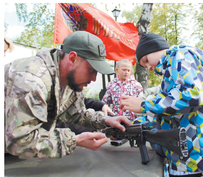
Пусть автоматы в руках мальчишек будут только учебные!