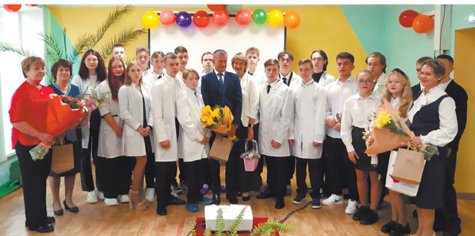
20 десятиклассников, которые мечтают стать медицинскими работниками, и почетные гости.

В школе №2 идёт капитальный ремонт здания, поэтому пока ребята будут заниматься на других площадках. В их расписании ежемесячные встречи с сотрудниками больницы. Главный врач, его заместители и другие медики будут проводить со школьниками, которые в будущем мечтают примерить белый халат доктора, беседы, занятия, экскурсии по отделениям. А после того как ребята вернутся в стены родной школы, их будет там ждать оборудованный на выделенные из регионального бюджета средства учебный класс с современными учебными пособиями для организации углублённого изучения профильных предметов – химии и биологии.