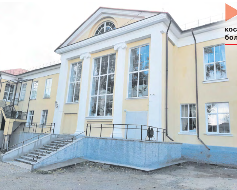
ЦК ИИ: теперь и вход со двора выглядит как парадный.

В историческом музее проведён капитальный ремонт кровли, это очень важное и долгожданное событие. Всё-таки музей – это хранилище фондов, а значит, там должно быть сухо и тепло. Благодаря новой кровле теперь и снаружи здание помолодело. В Доме культуры в Октябрьском