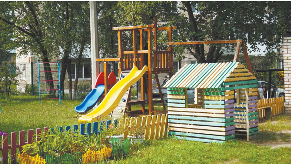
Территория детского сада «Ёлочка» заметно преобразилась.

Накануне начала учебного года в Режевском городском округе проведена приёмка 14 школ, 23 детских садов и 2 учреждений дополнительного образования. В межведомственную комиссию вошли представители администрации, Госпожнадзора, Роспотребнадзора, ОМВД, ГИБДД, Росгвардии, ЦРБ, УГХ.