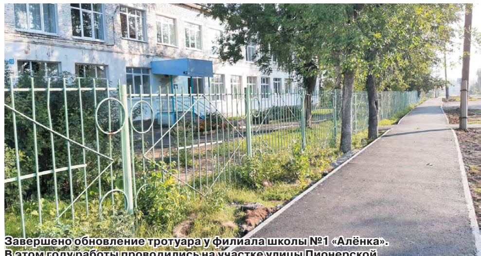
Завершено обновление тротуара у филиала школы №1 «Алёнка». В этом году работы проводились на участке улицы Пионерской (От ул. Свердлова до ул. Прокопьевской).