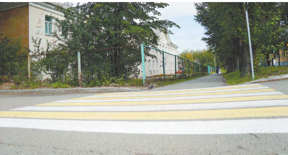
Дорога в школу должна быть безопасной.