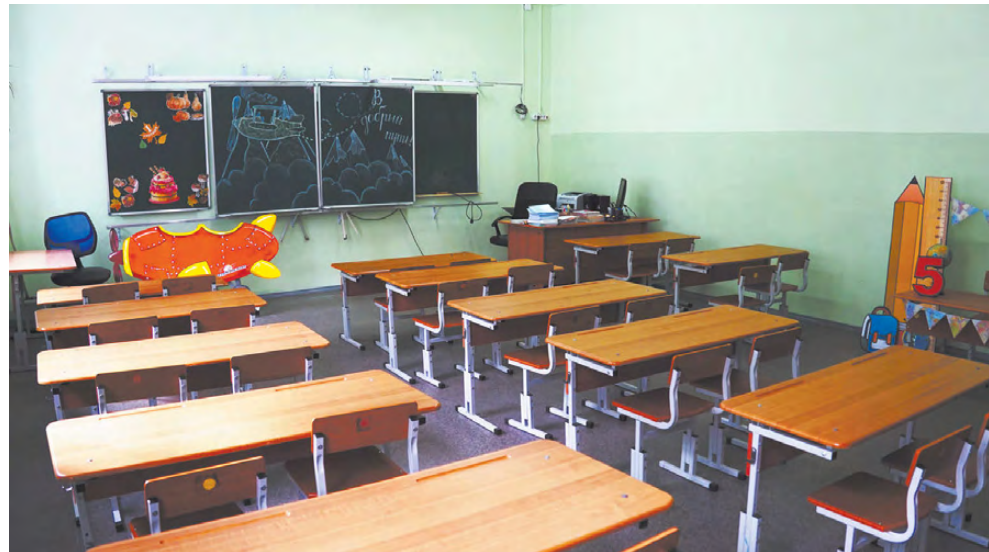
Красивые кабинеты в школе №3.

«Думаю, что многие жители нашего округа обратили внимание на новые ограждения в ряде детских садов. Ремонтные работы еще продолжаются. Приятно отметить, как преобразилась территория детского сада №30 «Ёлочка». В рамках программы «Доступная среда» созданы условия для получе-