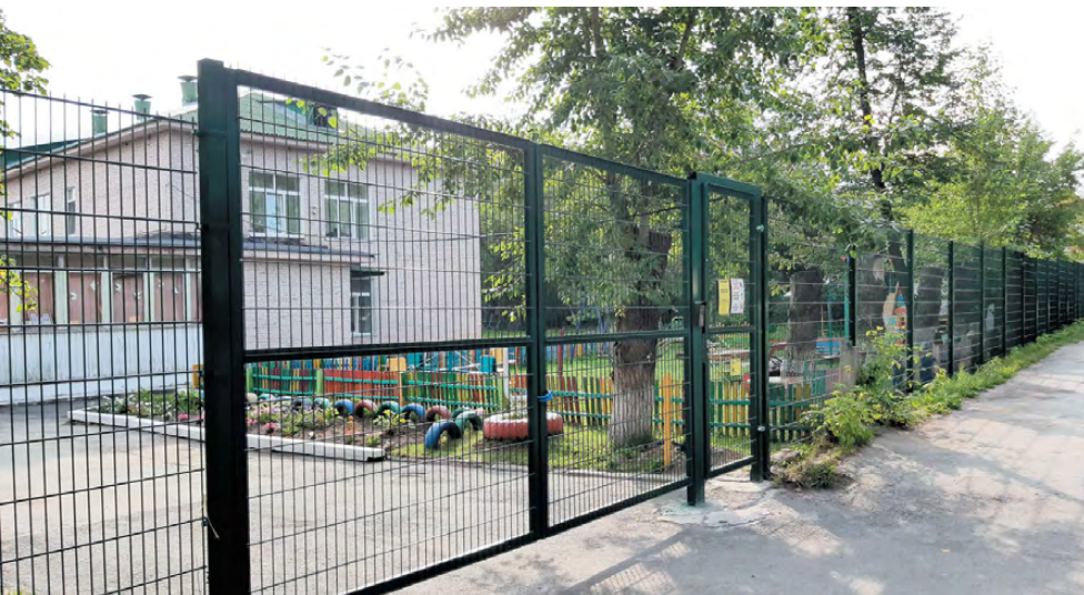
Новое ограждение по периметру территории детского сада «Золотая рыбка».

В 2023 году на замену ограждений в дошкольных образовательных учреждениях Режевского городского округа выделено более 15,5 миллиона рублей. Работы проводятся в детских садах «Аленький цветочек», «Белочка», «Колокольчик», «Золотая рыбка» (в том числе филиал в пос. Первомайском), «Теремок», «Вишенка», «Родничок» (с. Липовское), «Колосок» (с. Арамашка). В следующем году работы будут продолжены.