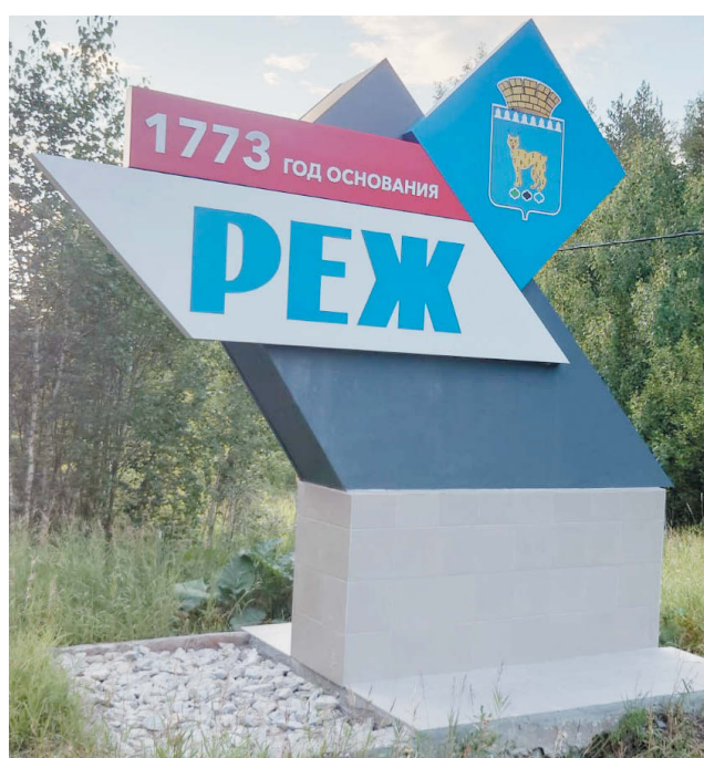
Стела на въезде со стороны г. Артёмовского.