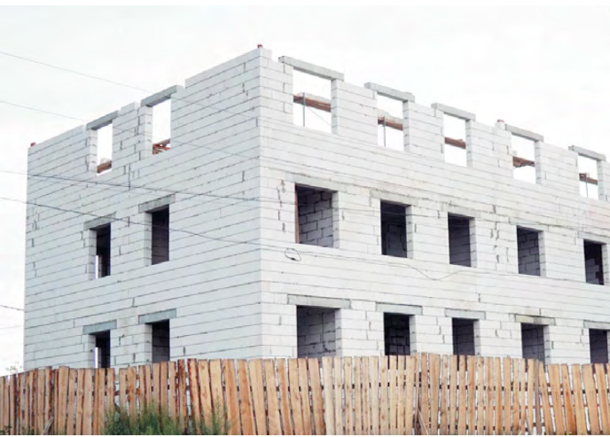
Идёт строительство 3-этажного дома на улице Черняховского.

Искренне поздравляем вас с профессиональным праздником – Днём строителя! Строитель – одна из самых почетных и благородных профессий. Каждый из вас вкладывает знания, опыт в улучшение качества жизни земляков. Вашими усилиями наш Режевской городской округ приобретает новый облик, строятся и ремонтируются объекты жилья, социальной и производственной сферы. И это лучший показатель того, что жизнь не стоит на месте, воплощаются в жизнь перспективные проекты и развивается инфраструктура.