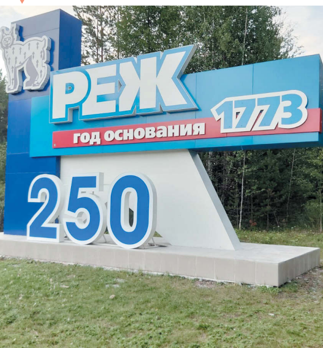
Стела на въезде со стороны г. Екатеринбурга.

Думаем, режевляне по достоинству оценят такие перемены!