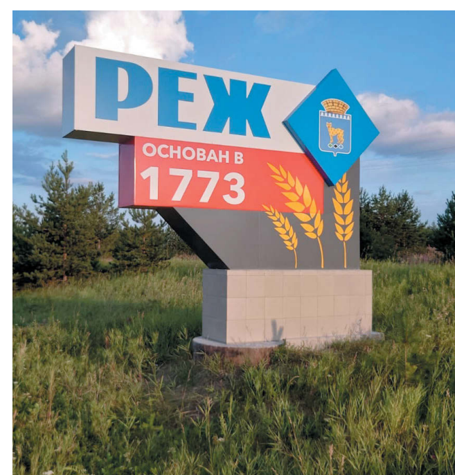
Стела на въезде со стороны с. Останино.