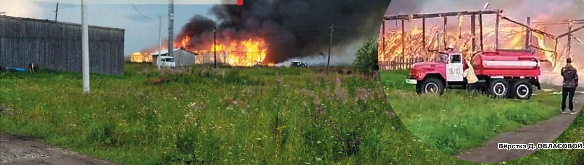
Вёрстка Д. ОБЛАСОВОЙ.

Пожарные предупреждают: будьте бдительны, при обнаружении огня и дыма незамедлительно звоните в МЧС, телефон экстренной службы – 112.