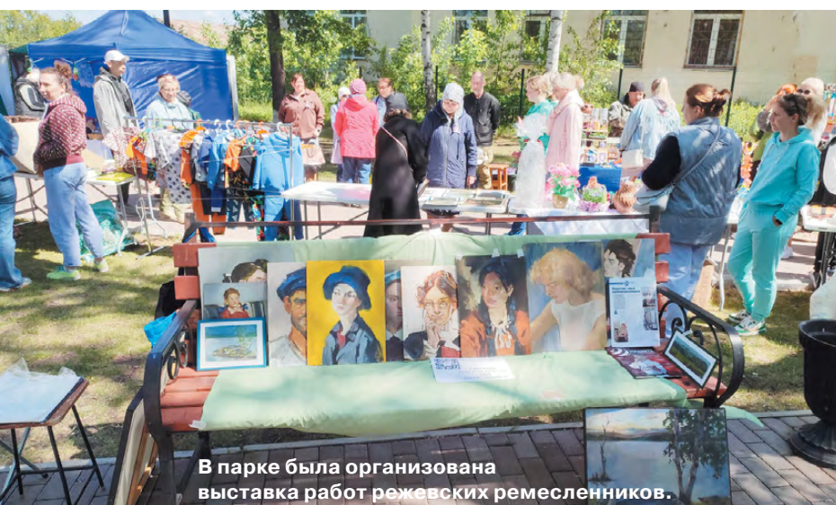
В парке была организована выставка работ режевских ремесленников.

12 июня в парке «Центральном» прошёл фестиваль народных хоров и фольклорных ансамблей «Душа России». Мероприятие было посвящено Дню России. Наша страна многонациональна и бережно хранит традиции и праздники представителей всех нацио-