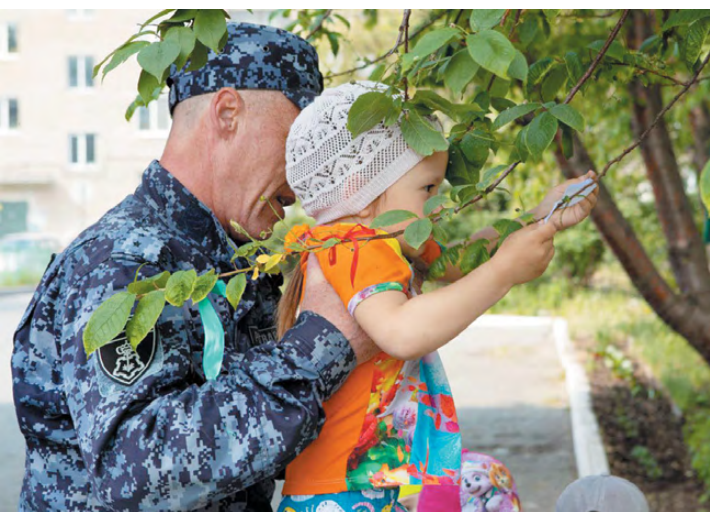
Вместе со взрослыми дошколята посадили цветы и украсили лентами деревья.

29 мая сотрудники вневедомственной охраны прибыли с визитом в садик. Поначалу дети отнеслись к таким серьезно выглядящим взрослым с опаской. Шутка ли – приехали на патрульной машине, в форме. Но сотрудники Росгвардии сумели расположить к себе ребят: в первую очередь они поздравили дошколят с праздником – Днём защиты детей. Затем они все вместе высадили цветы и украсили кустарники и деревья яркими лентами. Во время рабочего про-