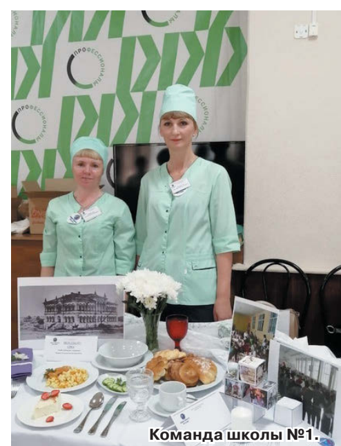
Команда школы №1.

ла, что это коллективная победа, работа всех сотрудников школы, благодаря которым есть возможность качественно выполнять работу: «Мы рады больше не тому, что победили, а что подтвердили свою квалификацию. И с уверенностью можем сказать, что наши дети в школе питаются вкусной и полезной едой».