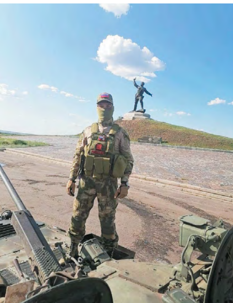
Павел мечтал связать свою жизнь с армией.

Режевляне помнят подвиг героев, которые противостояли фашизму в Великой Отечественной войне. И малыши-дошколята, и взрослые люди осознают,