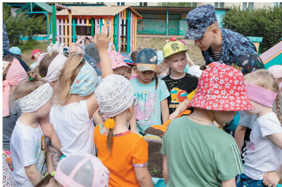
Дети с интересом общались с сотрудниками Росгвардии.

цесса дети буквально засыпали гостей вопросами, а те с готовностью на них отвечали. В завершение встречи ребята смогли рассмотреть патрульный автомобиль войск национальной гвардии РФ: заглянули внутрь и даже посидели за рулем.