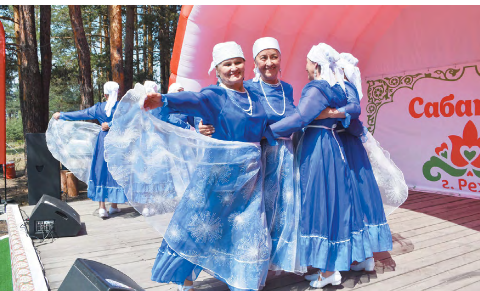
Творческие коллективы выступили с яркими вокальными и танцевальными номерами.