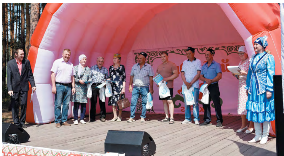
Глава РГО наградил благодарственными письмами волонтеров, участвовавших в тушении пожаров.