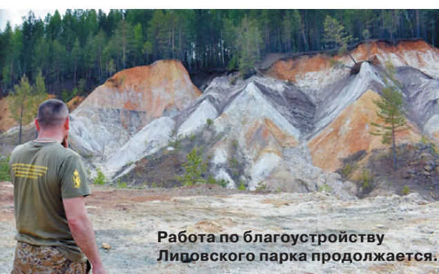
Работа по благоустройству Липовского парка продолжается.

ПОМНИТЕ! Нарушение правил безопасного поведения на воде – это главная причина гибели людей на водоёмах.