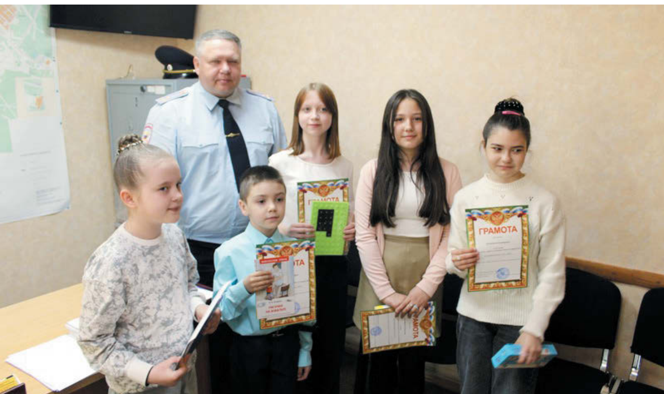
Победители районного этапа конкурса.

Подготовила Дарья ОБЛАСОВА.