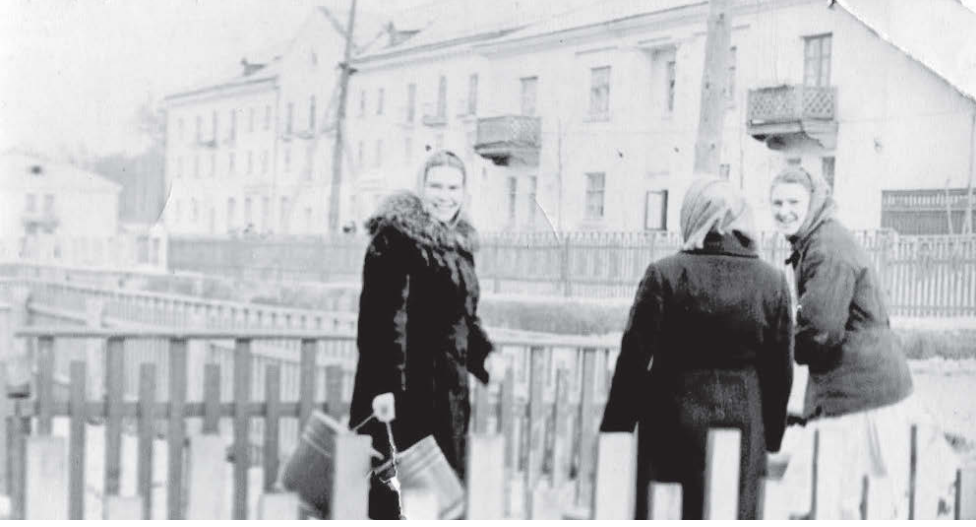
В первом в Реже трехэтажном доме по ул. Калинина, 24 открылся первый в городе современный магазин.

В честь юбилея в парке «Быстринском» прошел праздничный концерт, зрителями которого стали все режевляне!