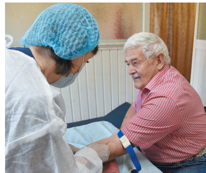
Диспансеризацию прошёл директор предприятия.

Медицинскими работниками Режевской ЦРБ при участии режевского филиала страховой медицинской компании «АСТРАМЕД-МС» на местном предприятии «Экспериментальный завод» проведена выездная диспансеризация. Акция способствует достижению ключевых показателей нацпроектов «Здравоохранение» и «Демография» и направлена на раннюю диагностику сердечно-сосудистых патологий, новообразований и хронических заболеваний у сотрудников завода без отрыва от рабочего процесса.