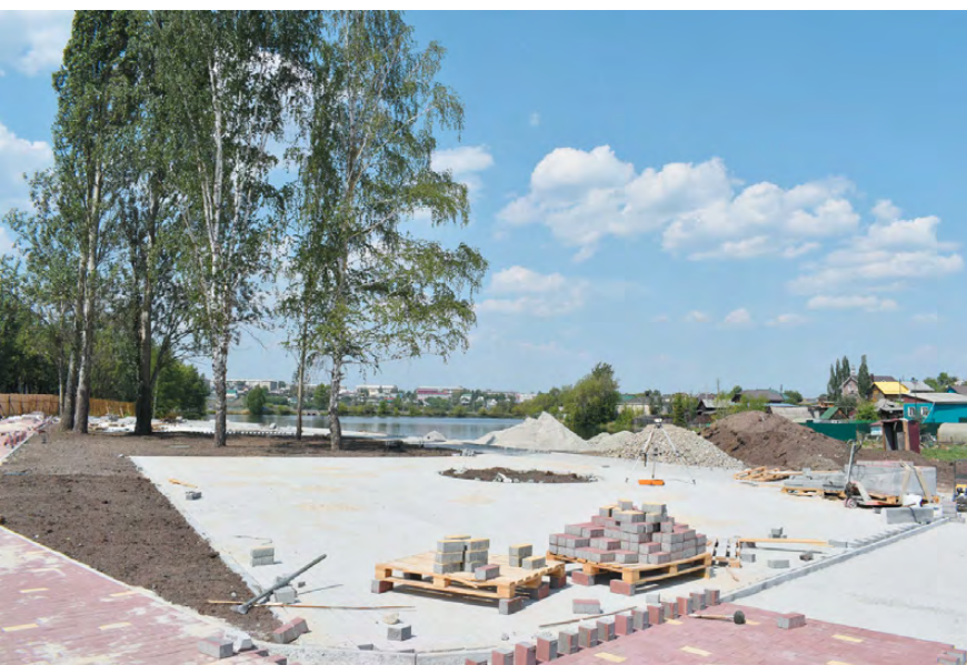
Работы по благоустройству «Талицкого» активно ведутся уже месяц.

Сегодня – финальный день голосования проекта «Формирование