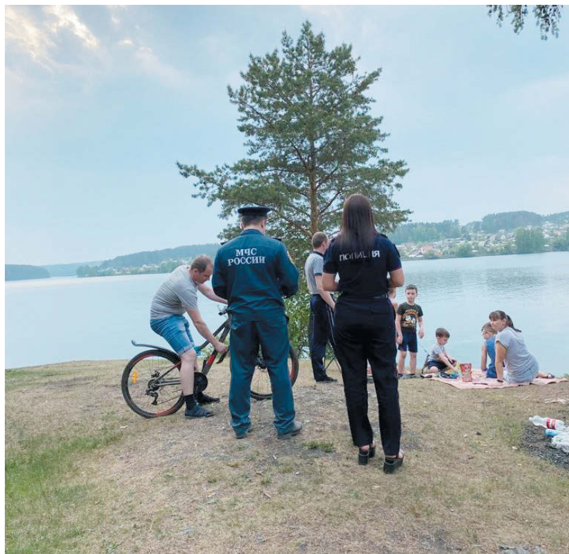
Группы проводят профилактические беседы и благодарят всех, кто соблюдает правила.

Люди с пониманием относятся к ситуации. Засушливая погода позволит огню, разведенному с неосторожностью и нарушением правил, с лёгкостью распространиться на постройки или леса. Именно поэтому важно соблюдать условия особого противопожарного режима.