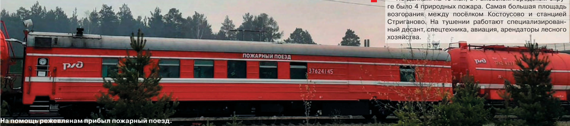
На помощь режевлянам прибыл пожарный поезд.

По данным на 16 мая, в Режевском городском округе было 4 природных пожара. Самая большая площадь возгорания между посёлком Костоусово и станцией Стриганово. На тушении работают специализированный десант, спецтехника, авиация, арендаторы лесного хозяйства.