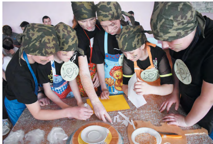
свой шедевр свежими ягодами.

I место заняли новички нашего шоу – команда школы №27 с. Арамашка! II место присуждено семиклассникам, III место – ученикам пятых классов. Команде 5-го класса «Кастриульки» выражаем отдельную благодарность, они в шоу участвовали впервые, но работали дружно. Самым красивым тортом признано кондитерское изделие команды 6-го класса: ребята украсили