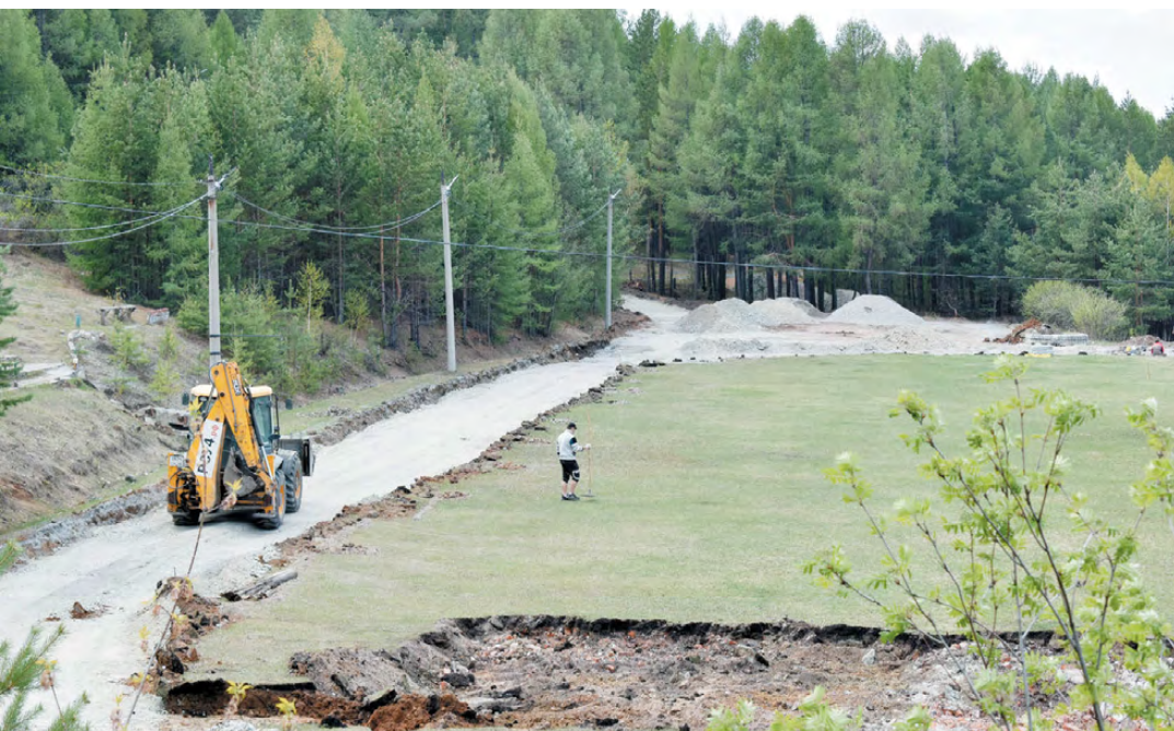
Уже в День города «Школьник» предстанет в новом облике.

22 мая для выпускников нашего города прозвучит последний звонок. В этом году для одиннадцатиклассников будет организован парад выпускников. Герои дня пройдут по центральной улице города. В связи с этим с 17.45 до 18.45 будет перекрыто движение транспорта по улице Советской от перекрёстка улиц Почтовая, Ленина и Советская до перекрёстка улиц Советская и Костоусова.