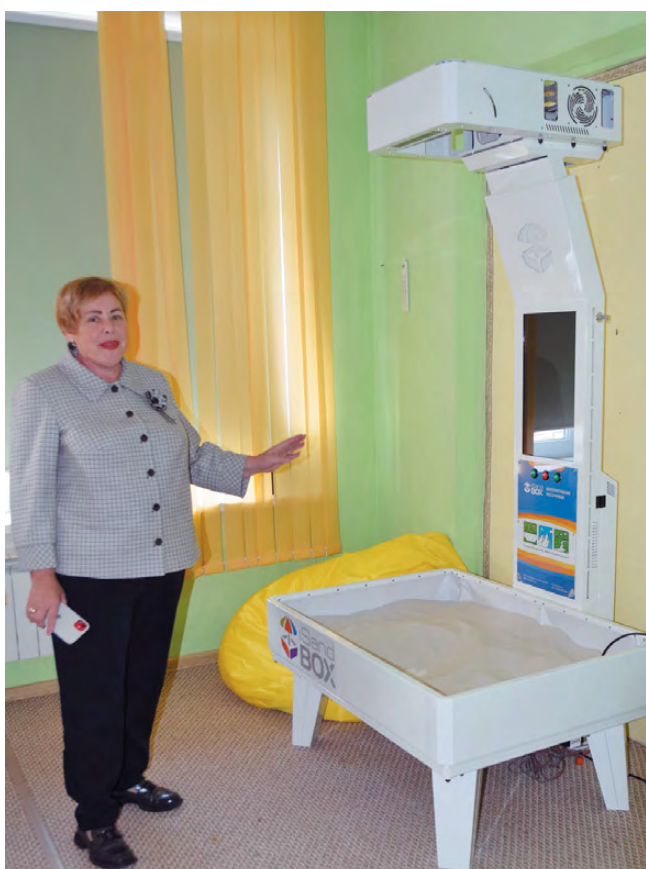
В каждом кабинете центра – современное оборудование, которое помогает педагогам в работе.

Еще одна программа центра также стала шагом на пути к победе. Специалисты центра «Дар» оказывают услуги ранней помощи семьям с неговорящими детьми. В 2019 году за помощью в центр обратились 2 семьи, на сегодняшний день на сопровождении находятся 100. «Город работает над проблемой. Вместе с управлением социальной политики, управлением образования, представителями здравоохранения мы обсуждали эту тему. И разработали единый алгоритм действий», – продолжает свой рассказ директор центра. Педагоги центра обучают и родителей,