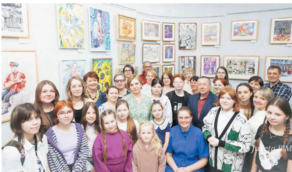
галереей Е. Н. Макарова.

На выставке представлена 101 работа. Это и натюрморты, и портреты, и пейзажи, и декоративные работы. «Такие выставки – они особенные. Талант педагога раскрывается не только под его кистью, но и в творчестве его учеников. Наблюдать эту преемственность увлекательно и трогательно. Ты понимаешь, сколько времени, сил, а самое главное, души вложил мастер в каждого своего воспитанника», – прокомментировала новую экспозицию заведующая муниципальной художественной