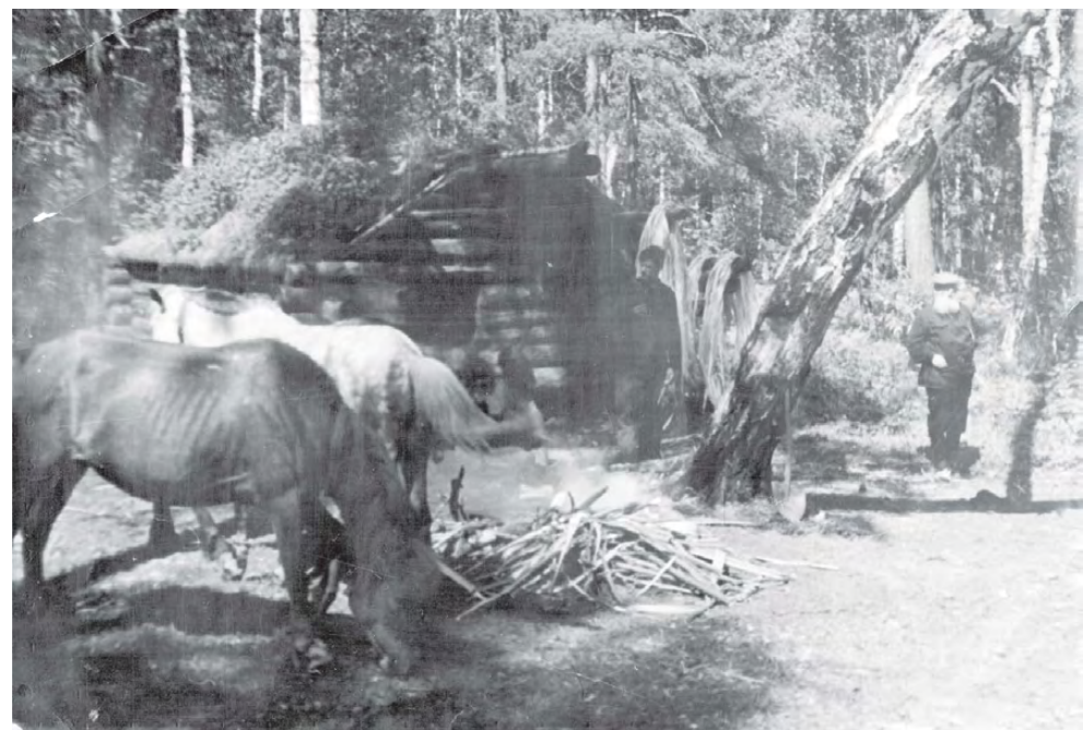
Павел Бажов на горе Азов в Полевском. Фото 40-х гг. XX века.

«Першинская I пещера» – древняя стоянка в одноименной каменной нише на правом берегу Режа, пониже деревни Першино. Изрядно потрудились здесь учёные из Института истории и археологии УрО РАН: подземный шурф принёс черепки сосудов Иткульской культуры двух типов: исетского и иткульского. Очевидно, что с Аятского очага иткульцы спустились по Режу до слияния с Адуем и далее. Близ устья Адуя, в лесу, путники углядели кряж, попирающий «обитель солнца». Здесь они вспомнили о своём полуфантастическом «первопредке», покровителе рода, заложив его идола