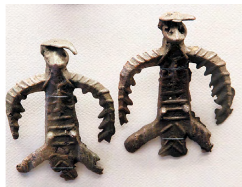
Птицевидные идолы. Город Полевской. Иткульская культура р. ж. в. (VI–III века до н. э.).

Над рекой Аятью (истоком Режа-реки), озером Аятским найдены следы жизни иткульцев, и прежде всего Аятское селище. В нем вынуты из раскопа: литейные формы, горшки из-под меди, развал печи, птичья фигурка.