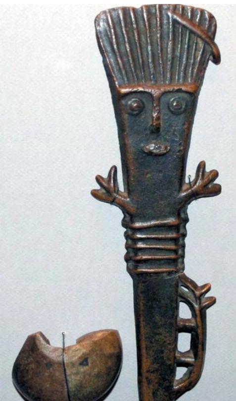
Человекоподобный идол. Адуйский Камень. Иткульская культура раннего железного века (VI–III века до н. э.).

У речного стремени Режа известно немало следов и пепелищ древнего бродяги-охотника. Это VIII–I тысячелетия до нашей эры. Знаковыми стали и живописные места при слиянии Режа и Адуя, где невдалеке вырастает на глазах Адуйский слоеный кряж. И не гадал крестьянин, да вынул там на свет из прозелени медные фигуры.