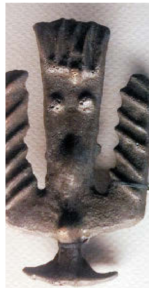
Птица-«перевёртыш» (вниз головой). Вместо хвоста – чуб и глаза человекоподобного идола. Иткульская культура р. ж. в. (VI–III века до н. э.).

Не одна голубая уральская нить – и река Реж в том числе, – связала в свое время большой загадочный мир солнечных куздесников.