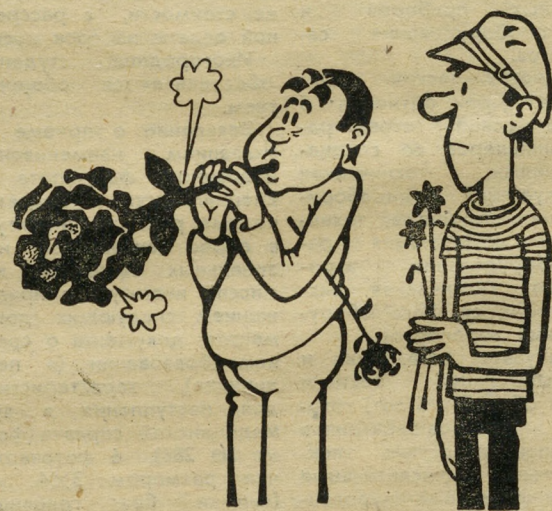
1. Цветы для любимой.