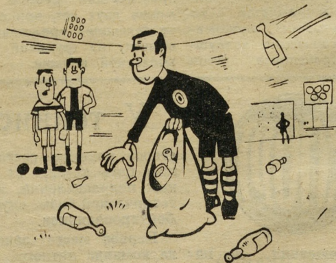
2. Завидное хобби у нашего судьи — на бутылки уже вторую машину покупает!