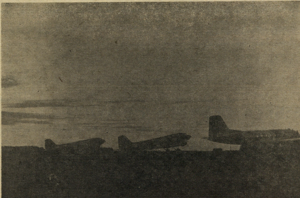
Челябинский аэропорт. В небо — готовы!