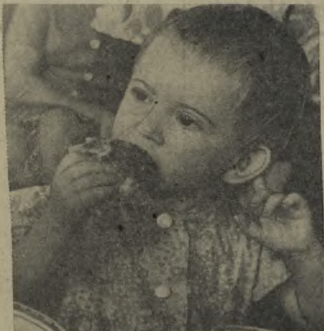
КАК ВКУСНО!