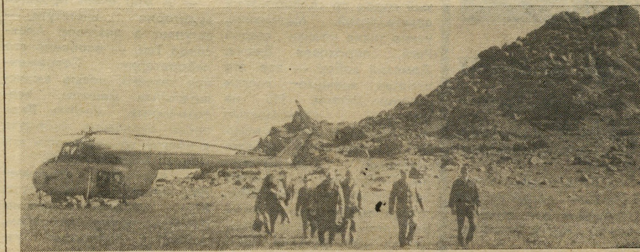
Работники института геологии и геохимии Уральского научного центра Академии наук СССР в прошлом году обследовали район Кытыла. Главным помощником их были вертолетчики Уктуса. Они доставляли поисковые группы (снимок первый), увозили образцы пород. На втором снимке: геологи за работой.