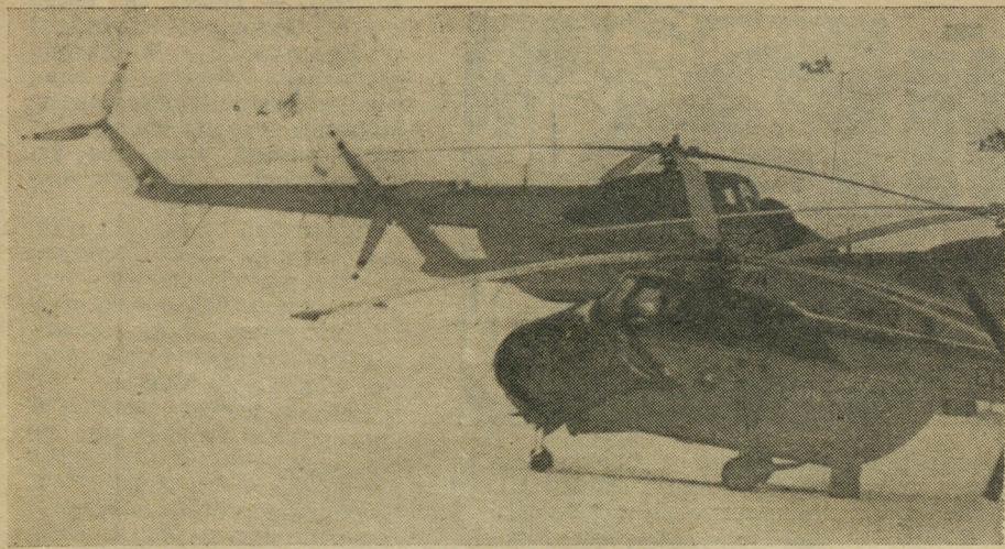
Вертолетная стоянка в Уктусе.