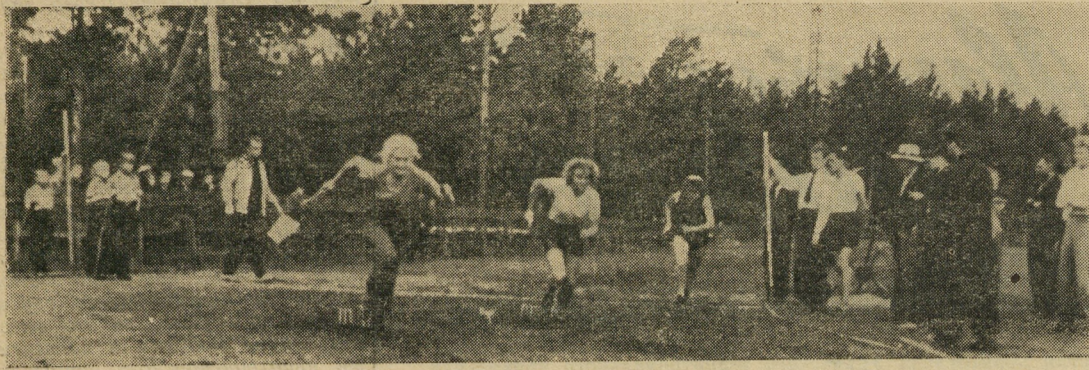
Дан старт женской эстафеты 4×100. Участницы состязания устремились вперед.

XII летняя традиционная спартакиада Уральского управления ГВФ