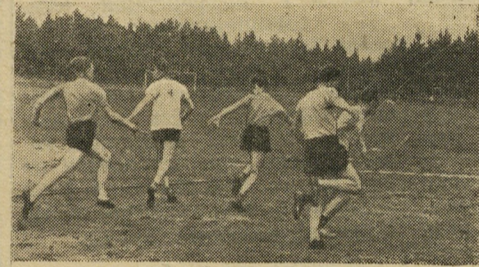
Быстро и хорошо передать эстафетную палочку — еще один шанс на пути к победе.

Дальше всех толкнул ядро М. Батог из авиатранспортного подразделения, на 3 см ему уступил С. Королев.