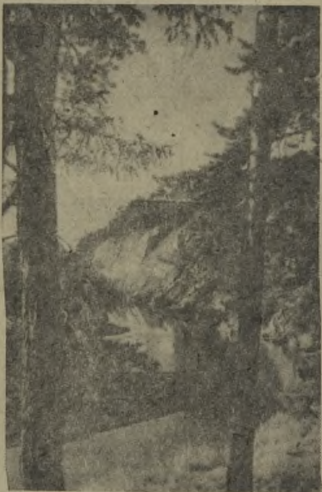
Фотоэтиюд. МИЛЫЕ СЕРДЦУ МЕСТА.