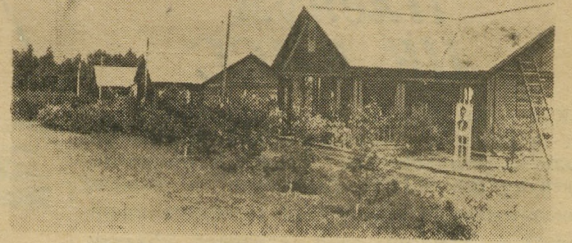
В этих удобных домиках спят ребята.