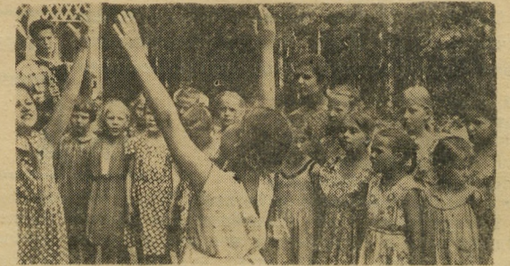
Возникший экспромтом танец собрал вокруг много ребят.