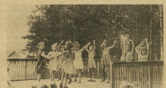
Выступает художественная самодеятельность.

Золотой порой счастливого детства является лето для советских ребят. Миллионы школьников выезжают на летние месяцы в пионерские лагеря, где проводят каникулы весело, интересно.