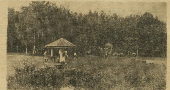
На территории лагеря.