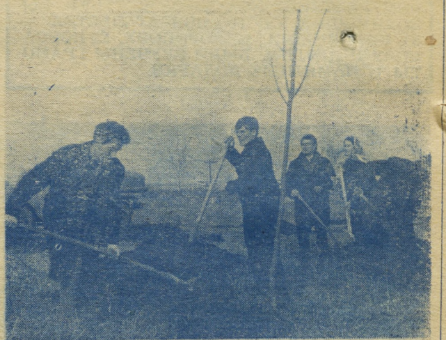
Около клуба Челябинского аэропорта весной зазеленеет молодая рощица. Ее посадили делегаты торжественного собрания, посвященного 50-летию ВЛКСМ.

Делегатам и почетным гостям вручаются памятные подарки. На торжественном собрании было принято обращение ко всем комсомольцам и молодежи управления.