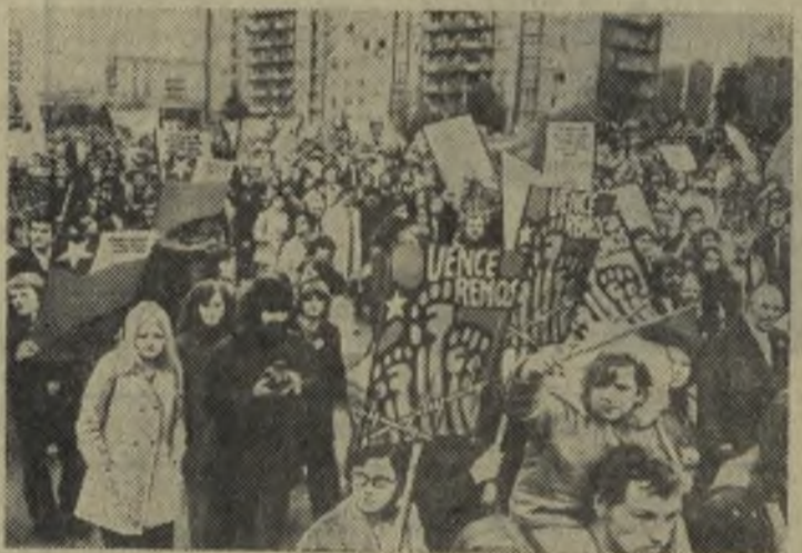
Братскую солидарность с народом Чили, борющимся против кровавого произвола фашистской хунты, выражают трудящиеся Германской Демократической Республики. «Венсеремос!» («Мы победим!») — гласят плакаты берлинцев — участников демонстрации.

На снимке: здесь трудится бригада оналужников.