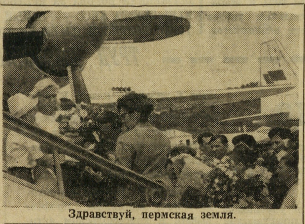
Здравствуй, пермская земля.