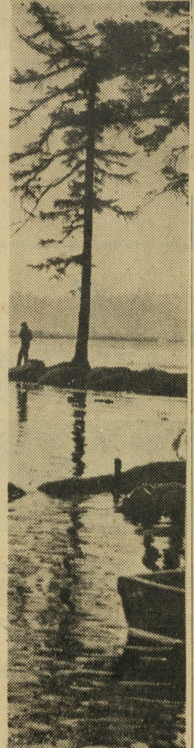
Блики летнего заката отпылали над рекой. Ветерок умчал куда-то, Вслед за солнцем, На покой.