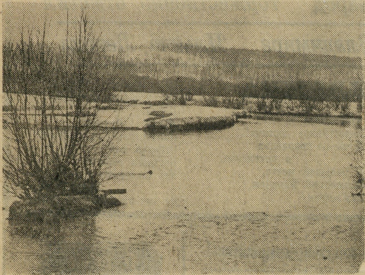
ВЕСЕННЕЕ ПОЛОВОДЬЕ.