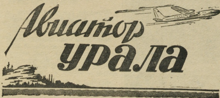
Рисунок П. Васильева.

Орган политотдела Уральского территориального управления ГВФ и теркома профсоюза авиаработников