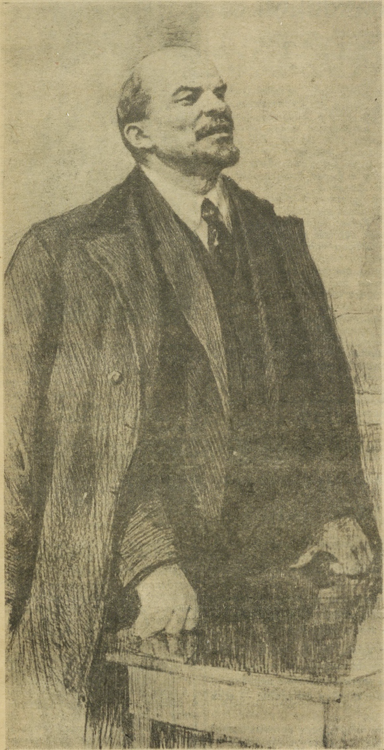
Владимир Ильич Ленин на трибуне.