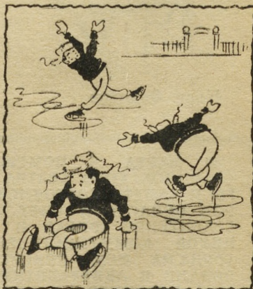
Впервые на льду.