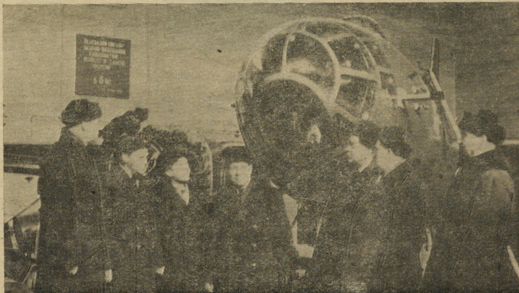
Члены делегации Северного управления ГВФ знакомятся с работой ЛЭРМ Свердловского аэропорта.