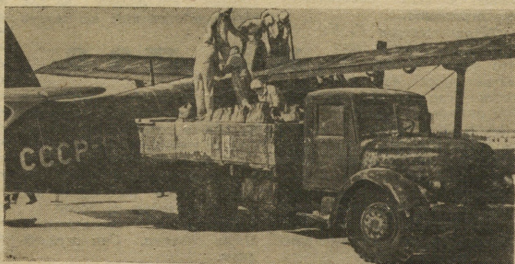
Лишь 5—6 минут требуется для того, чтобы заполнить бак спец-аппаратуры ядохимикатами.

На снимке: загрузка самолета Ан-2 на оперативной точке.