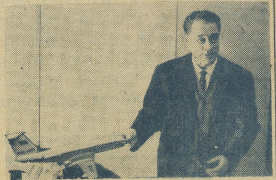
На снимке: министр гражданской авиации Е. Ф. ЛОГИНОВ.

В 1965 году по воздуху будет переброшено свыше миллиона тонн грузов и почты, а пассажирские перевозки возрастут по сравнению с 1964 годом на 17,7 процента. Большое внимание сейчас уделяется строительству и реконструкции аэропортов, аэровокзалов и гостиниц.