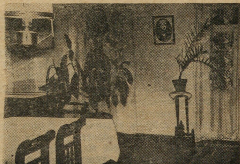
Гостиная дома Ульяновых

лева (бывшая Ново-Комиссарьятская). На нем установлена мемориальная доска. Она гласит: «В этом доме 5 декабря 1887 г. был арестован В. И. Ульянов (Ленин), студент Казанского университета, за участие в революционном движении студентов». До 7 де-