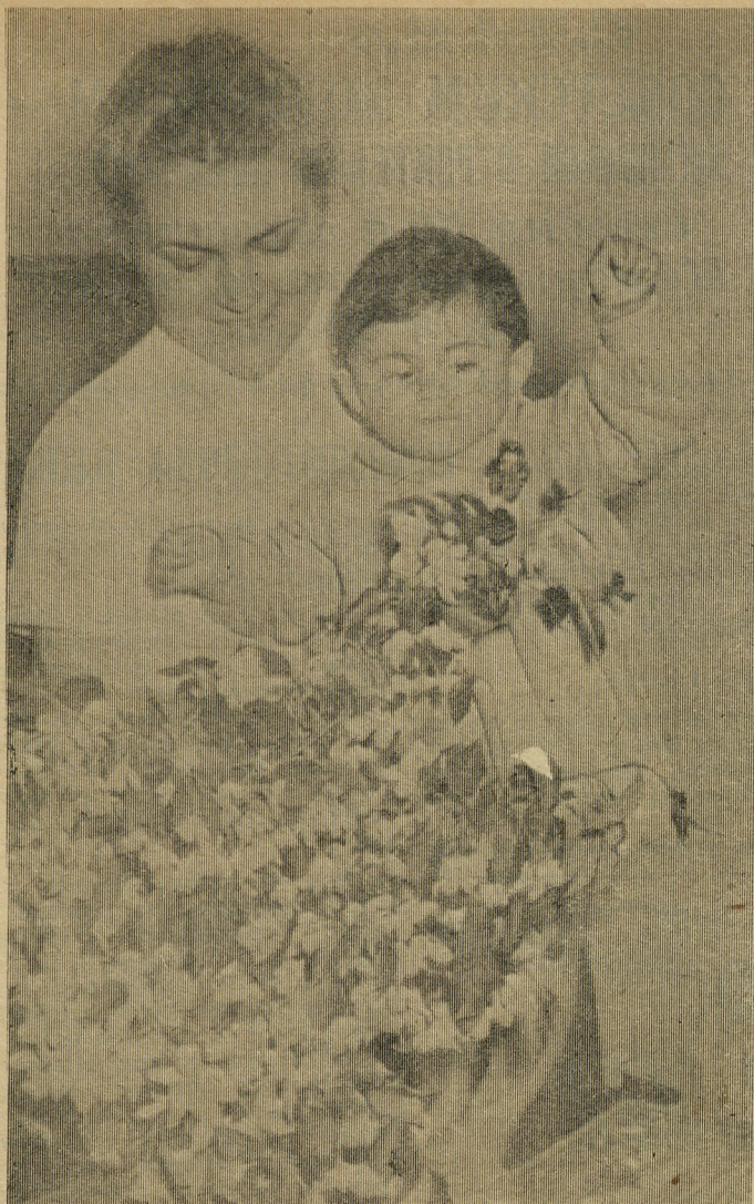
Материнское счастье