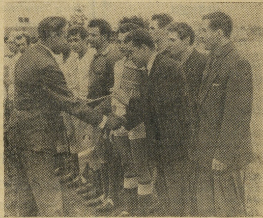
Торжественная минута вручения наград победителям.