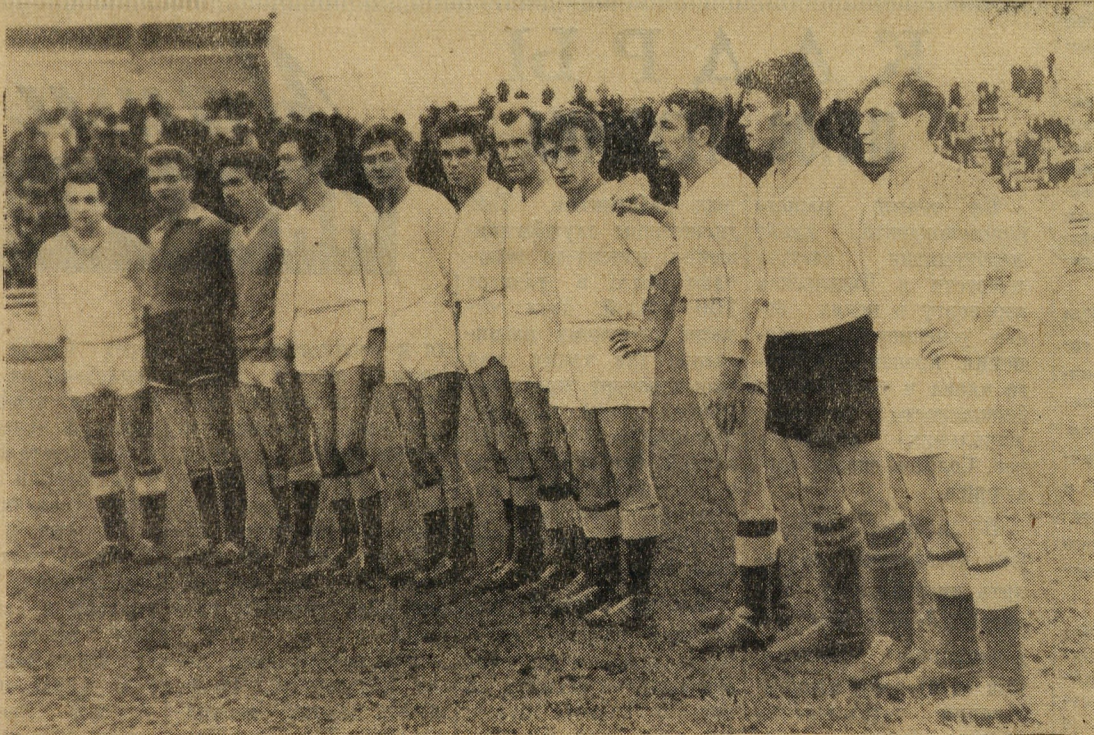
Вот они, счастливые обладатели кубка Аэрофлота СССР.

Однако сказывается их слабая физическая подго-