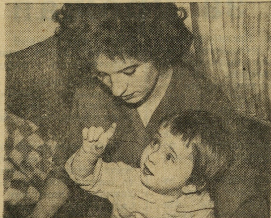
В полете как дома.