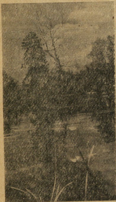
ТИХИМ ЛЕТНИМ ВЕЧЕРОМ Фотоэпюд Б. ЗАХАРОВА.

Тип. из-ва «Уральский рабочий». Свердловск, ул. Ленина, 49.