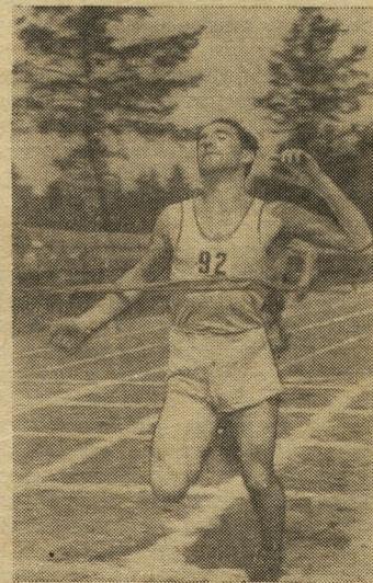
Редактор Р. ЛАПИКОВ.

Б. МЫМРИН, комсорг летного коллектива авиатранспортного подразделения.