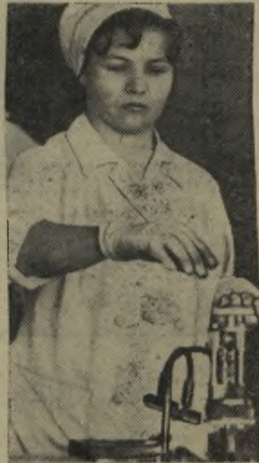
Коллектив московского завода «Хроматрон», откликаясь на обращение ЦК КПСС к партии, к советскому народу, взял обязательство: выполнить государственный план четвертого года пятилетки 26 декабря.

Горкому ВЛКСМ предложено повысить уровень работы школьных комсомольских и пионерских организаций, обеспечить выполнение мероприятий программы «Комсомол — сельской школе».