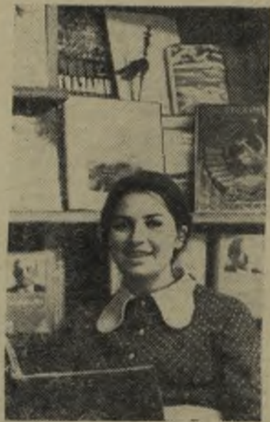
Москва. В ордена Трудового Красного Знамени 1-й Образцовой типографии имени А. А. Жданова печатаются подписные издания, политическая и художественная литература, учебники.

Производство типографии составляет почти в тридцать стран.