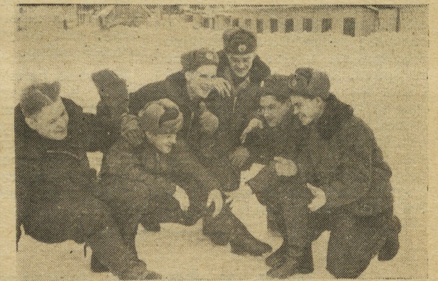
Шутка — добрая помощница. Второй справа — Г. Титов.

ся космонавтом, имя которого повторяет весь мир. Как это замечательно!.. В 1958 году мы расстались с Германом, но наша переписка продолжалась еще долго. В своем семейном альбоме я бережно храню любительские фотографии, на которых запечатлен летчик-космонавт.