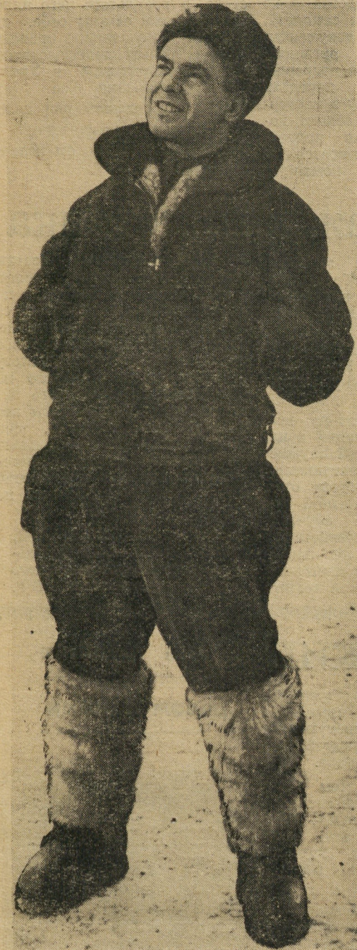
Скоро в небо!

Как только я услышал весть из Москвы о запуске второго космического корабля и узнал о космонавте из биографической справки, я убедился, что речь идет именно о нем, моем хорошем друге, с которым вместе мы учились в авиационном училище, а затем служили в одном истребительном полку.