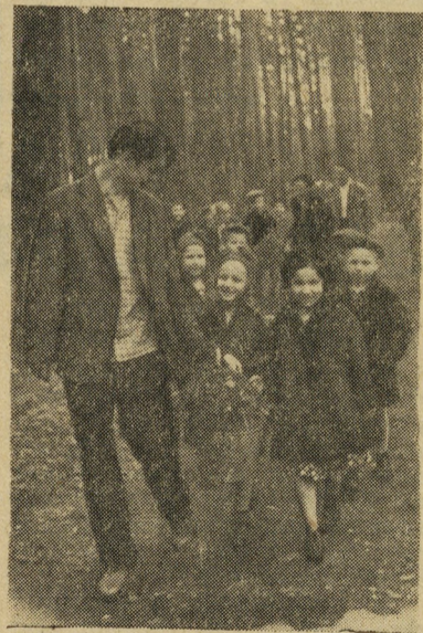
Друзья на прогулке.

Авиаработники с интересом прослушали лекцию. Лектору было задано много вопросов, на которые он дал обстоятельные ответы. И. ЦЕХАНОВИЧ, заведующая клубом Свердловского аэропорта.