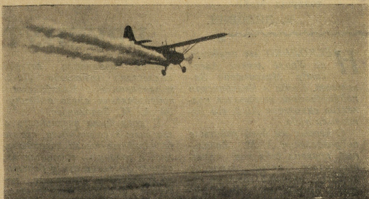
НАД КОЛХОЗНЫМИ ПОЛЯМИ