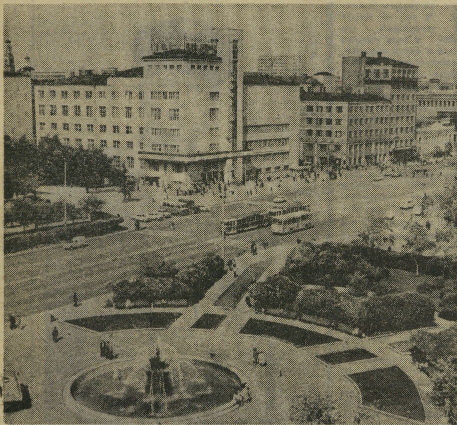
В центре города Свердловска.

В ФЕВРАЛЬСКУЮ МЕТЕЛЬ или в июльскую жару — всегда поднимаются с Уктусского аэродрома винтокрылые машины Ми-2. Нет на белосиних вертолетах особых опознавательных знаков красного креста, но почти каждый из полетов — выполнение санитарного задания. Ведь каждый полет — это оказание срочной помощи больному, а порой и спасение его жизни.