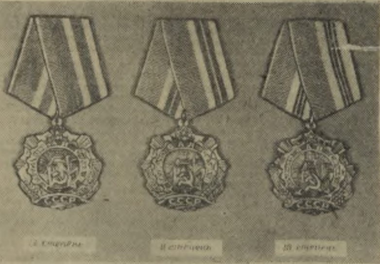
ОРДЕН ТРУДОВОЙ СЛАВЫ СПРАВА — МЕДАЛЬ «ВЕТЕРАН ТРУДА»

На снимке: Н. С. МЕЛЬНИКОВА.