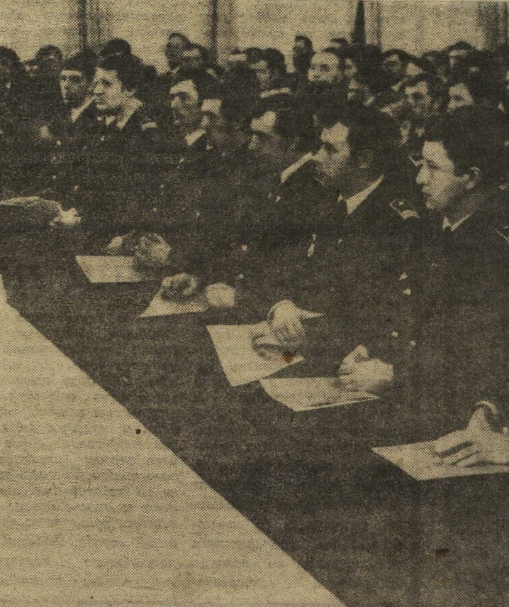
В зале приемов Центрального Комитета ВЛКСМ.

III Всесоюзный слет молодых передовиков сельскохозяйственной авиации завершился своей работой. Участники слета развлеклись по своим авиапредприятиям, чтобы с новыми силами, с молодым комсомольским задором активно включиться в работу и повести за собой тысячи молодых авиаторов на новые трудовые свершения, на досрочное выполнение планов 1976 года и исторических решений XXV съезда КПСС.