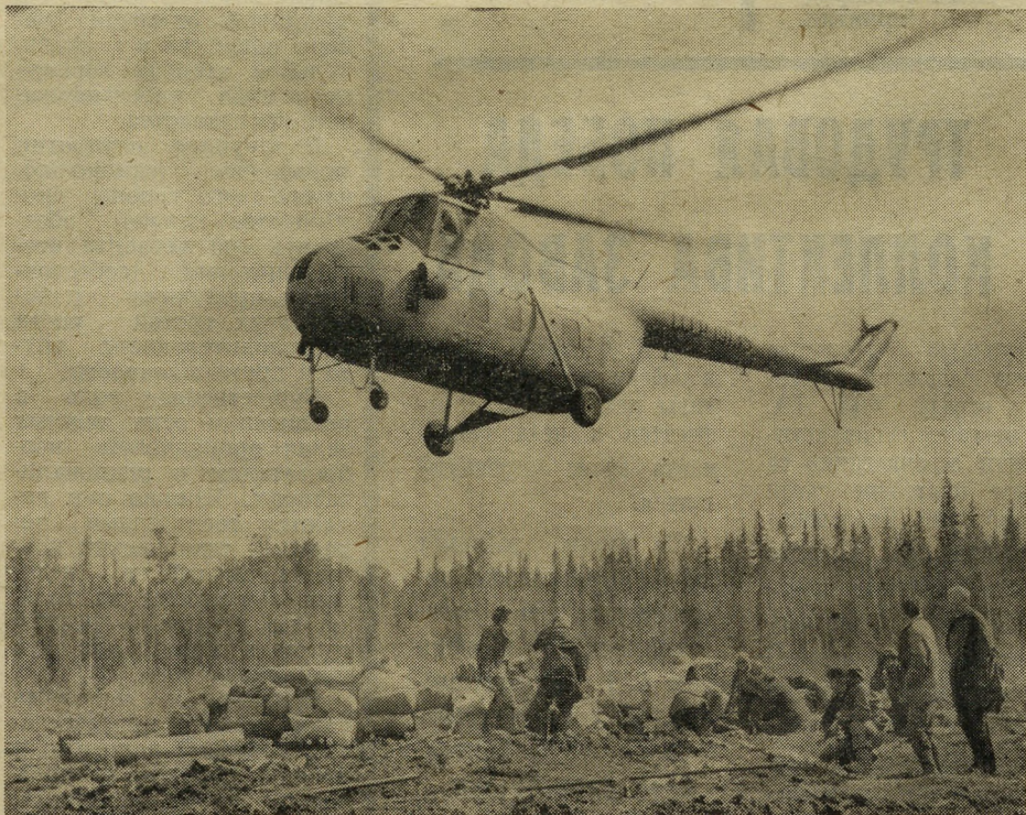
Вертолеты Уктусского авиапредприятия — верные помощники геологов.