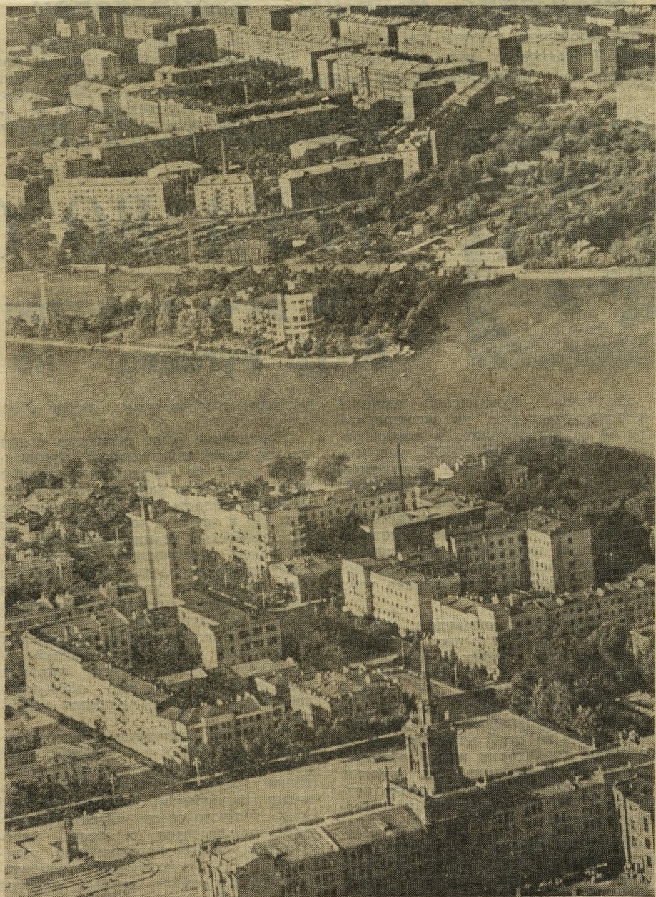
ГОРОДА УРАЛЬСКОГО УПРАВЛЕНИЯ. СВЕРДЛОВСК С ВЫСОТЫ.

По указанию министра гражданской авиации в предприятиях Аэрофлота в 1974 году объявлен конкурс по темам «Механизация наружной мойки и внутренней уборки самолетов и вертолетов, содержание интерьеров пассажирских салонов».