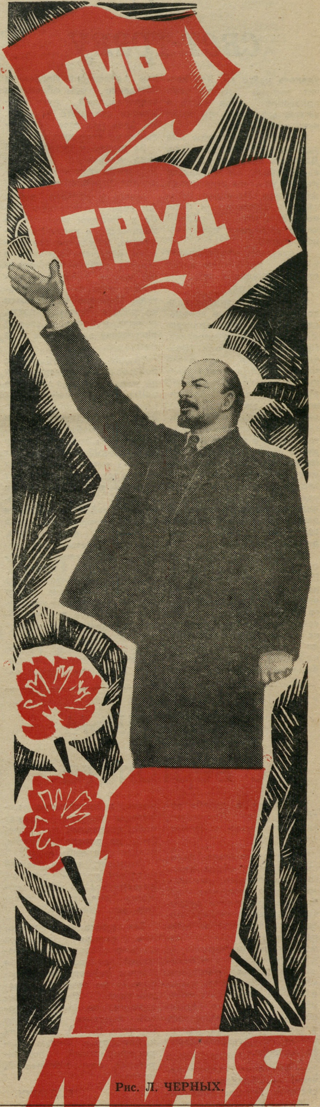
Рис. Л. ЧЕРНЫХ.

В РЕЗУЛЬТАТЕ УДАРНОГО ТРУДА В ФОНД ПЯТИЛЕТКИ ПЕРЕЧИСЛЕНО 8191 РУБЛЬ.