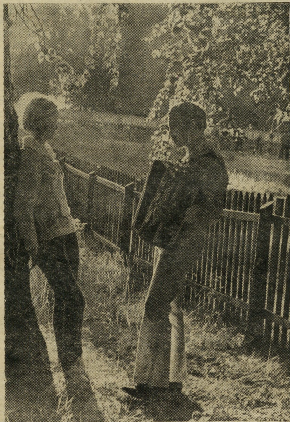
«Свидание» — так назвал свой фотоснимок наш нештатный фотокорреспондент.