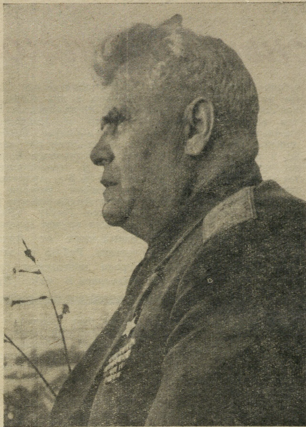
Один из первых Героев Советского Союза, поллярный летчик М. В. Водопьянов. Снимок сделан во время приезда авиатора в Свердловск.