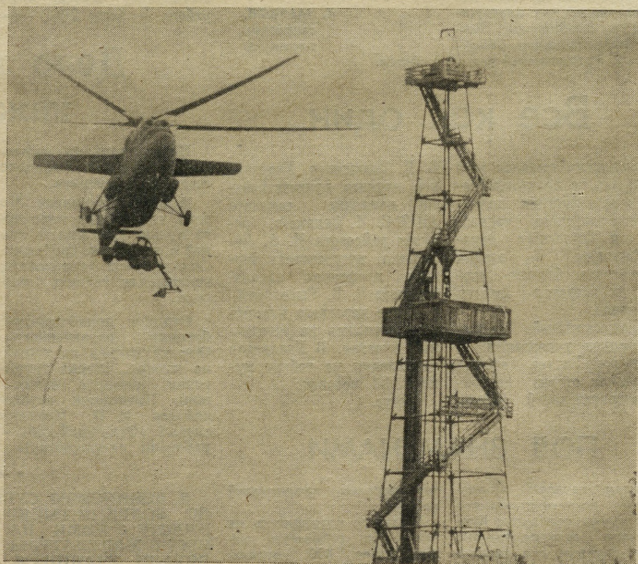
ВЕРТОЛЕТ ПРИЛЕТЕЛ НА БУРОВУЮ.

На заводе 404 монтируется стенд для испытания вертолетных редукторов. Ведется работа по централизации откачки отработанного масла. Намечен ряд мероприятий по механизации погрузочно-разгрузочных работ, в том числе: механизация подачи двигателей в ремонт, подачи в цех запчастей. Ведется и установка монорельса с пневмоподъемником на участке промывки деталей после их магнитного контроля.