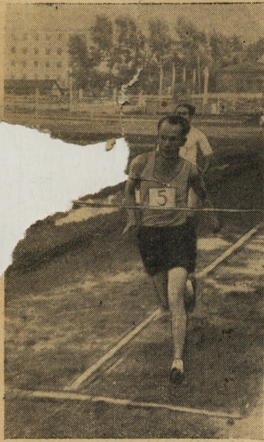
У финиша стометровой дистанции.

...Разминка. В эти считанные минуты, оставшиеся перед забегом, спортсмены опробывают грунт дорожки, по которой придется бежать. А грунт, надо сказать, неважный. Только что закончился дождь и в некоторых местах дорожки стоит вода.