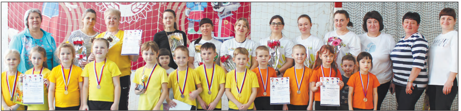
Прыгать вместе с мамой – веселое занятие!