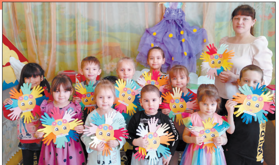
Место под солнцем есть у всех!