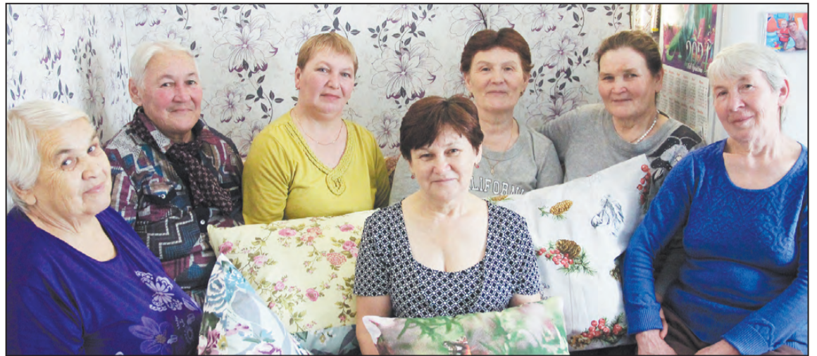
«Реальные бабки».