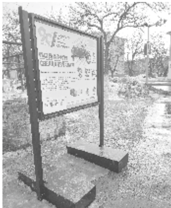
Условия лотереи были на каждом шагу