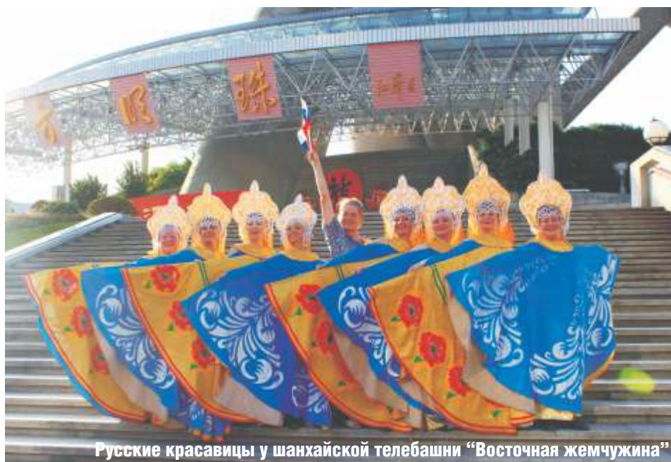
Русские красавицы у шанхайской телебашни "Восточная жемчужина"