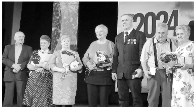
Знаком "Совет да любовь" наградили 5 семейных пар