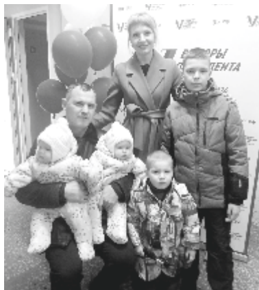
Голосовали целыми семьями