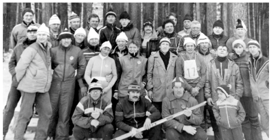
Участники марафонской лыжной гонки в честь 50-летия Юрия Боярского, 1989 год.

Алёна АРХИПОВА, Фото из архива Ю.П. Боярского