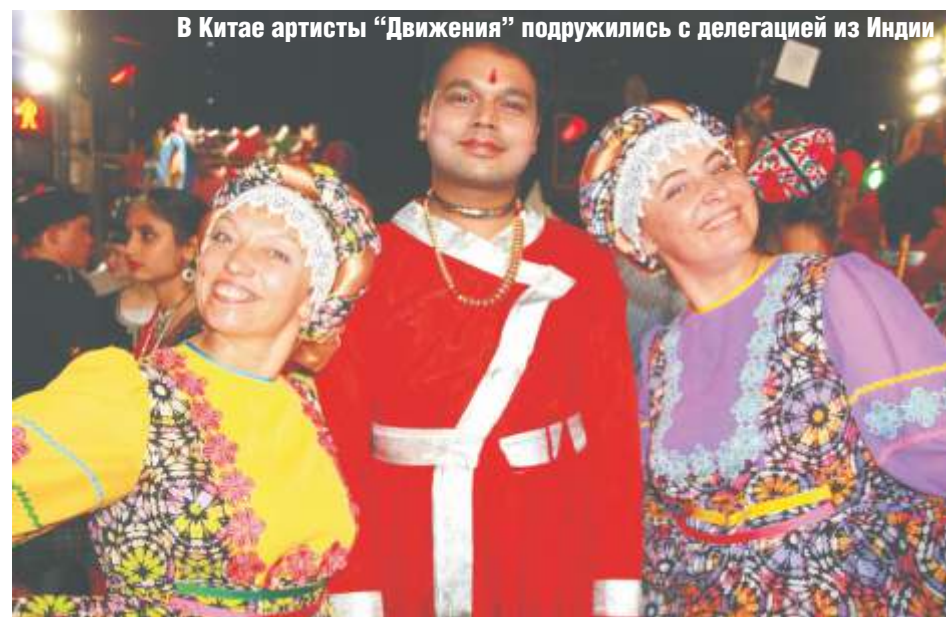
В Китае артисты "Движения" подружились с делегацией из Индии