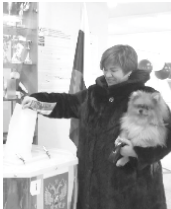
...И с питомцами