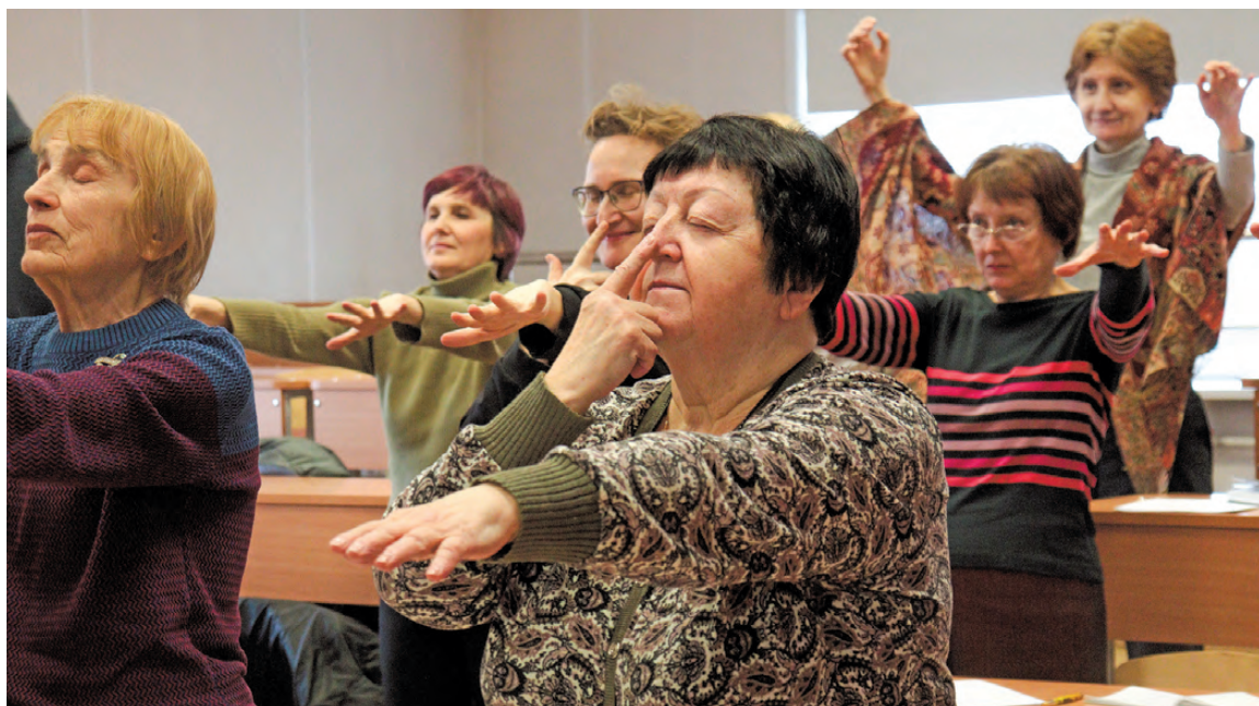
Слушателям предлагают тесты — проверить, как работает мозг.

В Уральском университете проводят занятия для сохранения когнитивных способностей