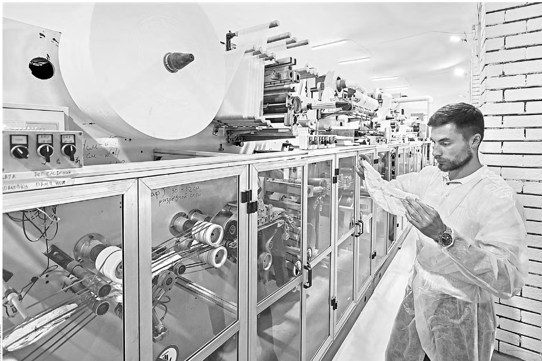
28 миллионов рублей, в том числе средства льготного займа, инвестировано в проект, реализованный в Белоярском районе Свердловской области.