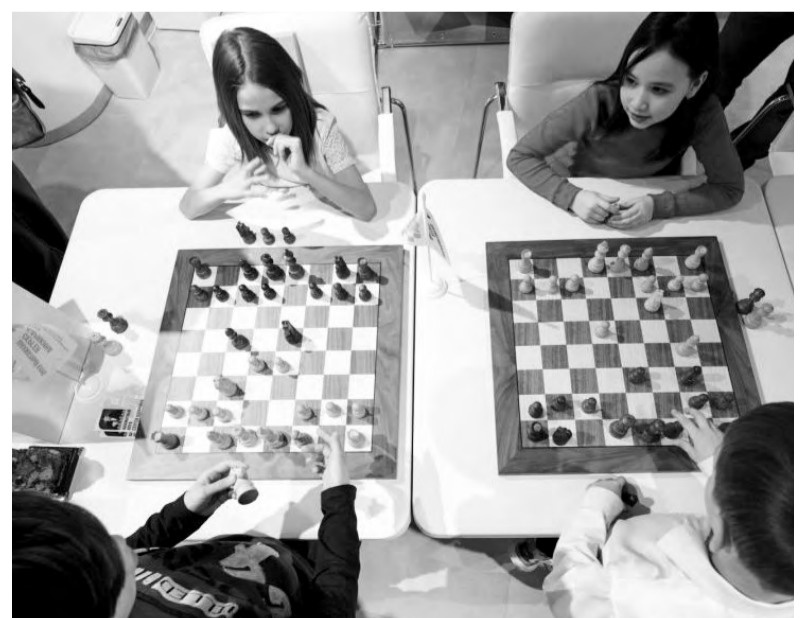
По информации департамента информполитики СО

Напомним: шахматы являются базовым видом спорта для Свердловской области. 14 марта глава региона Евгений Куйвашев принял участие в открытии Шахматного клуба Сергея Карякина. Клуб объединит любителей шахмат любого возраста: и взрослых, и детей. В регионе также успешно работают множество секций и спортивных отделений шахматного спорта. Весомый вклад в подготовку профессиональных шахматистов вносят «Уральская шахматная академия» и специализированная школа «Интеллект». Координацию по развитию шахмат на Среднем Урале осуществляет Федерация шахмат Свердловской области. В период 2022-2023 годов спортивные разряды присвоены 94 шахматистам из Свердловской области. Кроме того, в прошлом году свердловские спортсмены завоевали 51 медаль различного достоинства на официальных Всероссийских соревнованиях.