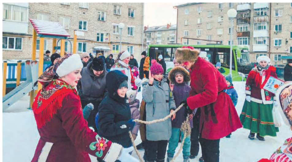
Желающих принять участие в народных играх было хоть отбавляй