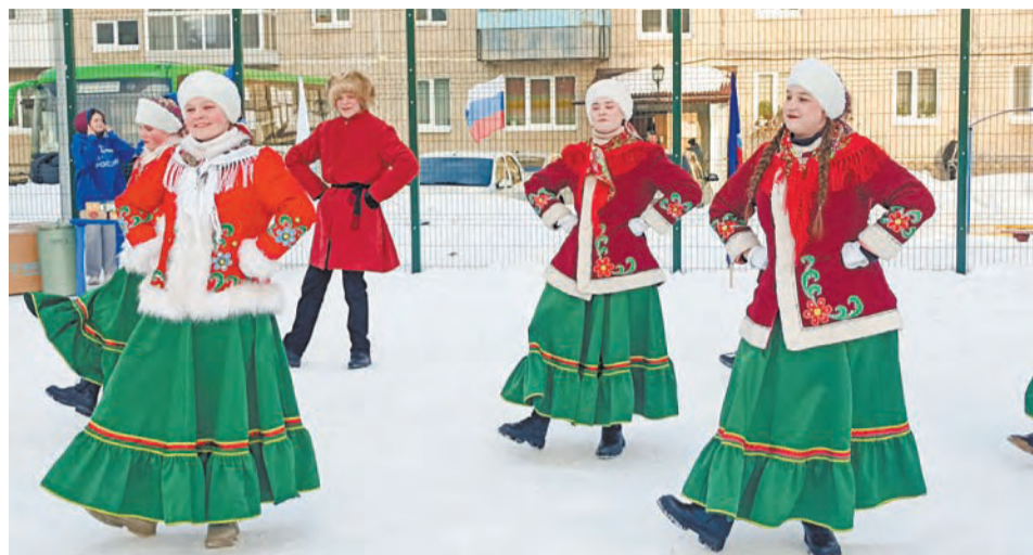
Зажигательные танцы от коллективов ДК им. В. К. Костевича