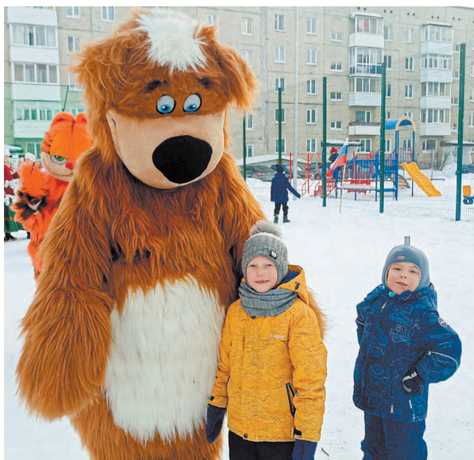
Ирбитских ребятишек развлекали ростовые куклы