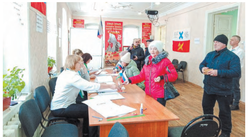
Практически на всех участках ирбитчане были с самого утра