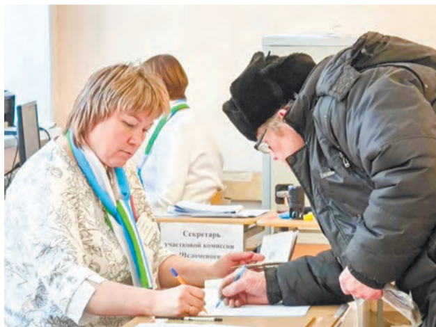
Идет сверка паспортных данных