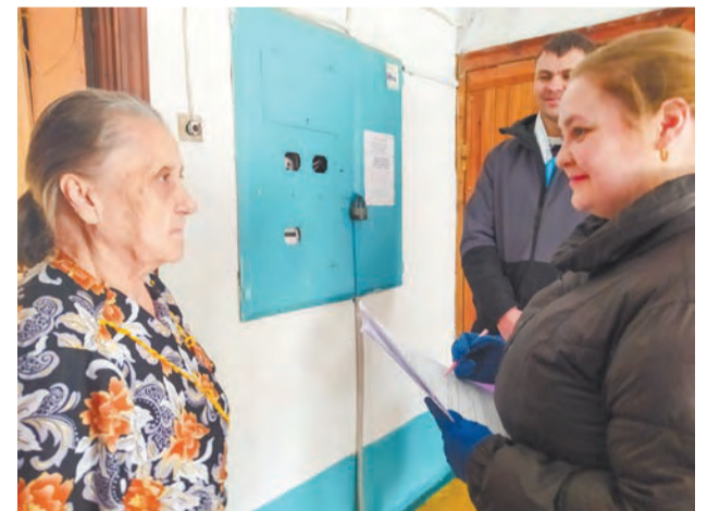
К пожилым людям избирком приходил на дом