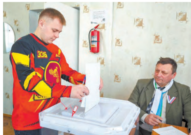
На участок пришли ирбитские мотогонщики в спортивной экипировке