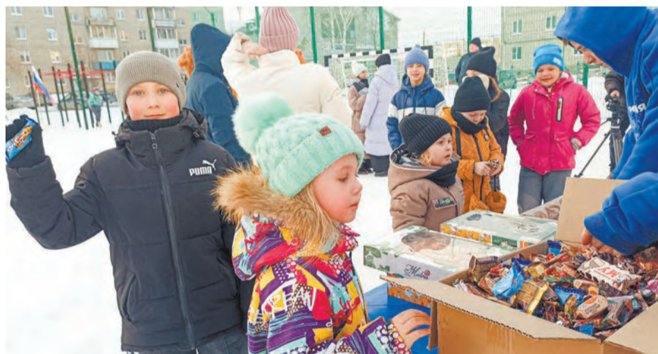
Нам конфеты?! Здорово!