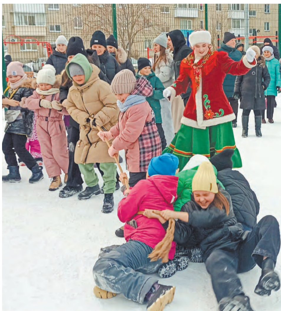
Перетягивание каната всем двором – что может быть веселее?!