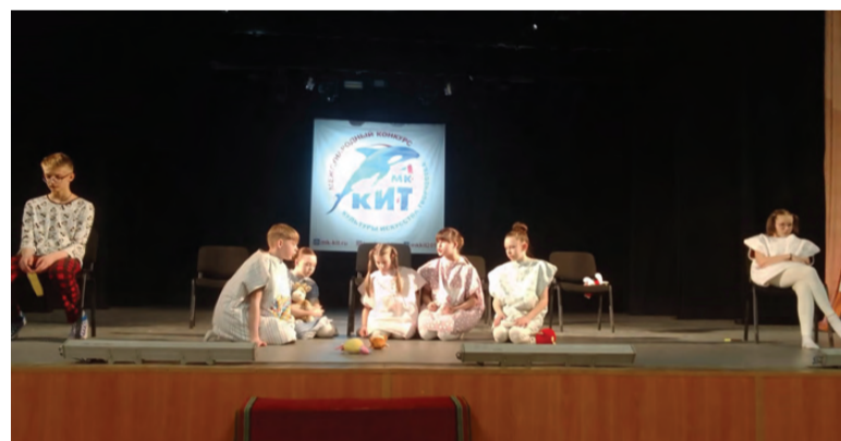
Конкурсный показ спектакля «Подушки»

поставили в прошлом учебном году для городского конкурса «Театральная весна». За его показ «Сюрприз» был удостоен 3-го места. За короткий период мы восстановили спектакль и представили в ДК «Юбилейный» Нижнего Тагила, где проходил конкурс «КИТ».