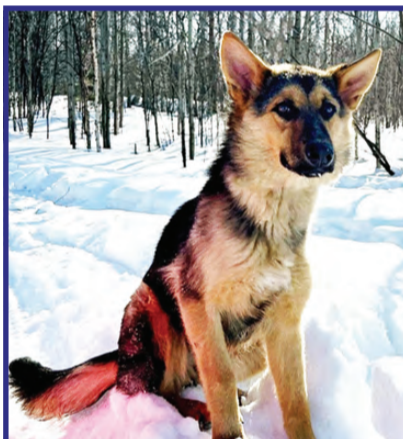
Чара, 7 мес., типаж овчарки, окрас черный с подпалым, ниже среднего размера, верная, умная, привита, стерилизована. Тел. 8-922-600-10-21, 8-950-649-44-62, сайт pervo-priut.ru