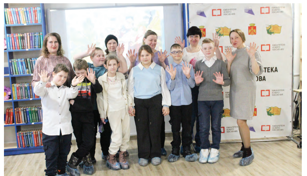
Участники литературной карусели