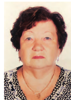
Городской Совет ветеранов, администрация ГО Красноуральск