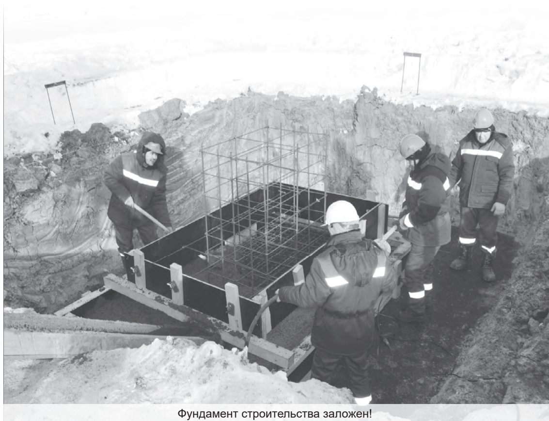
Фундамент строительства заложен!