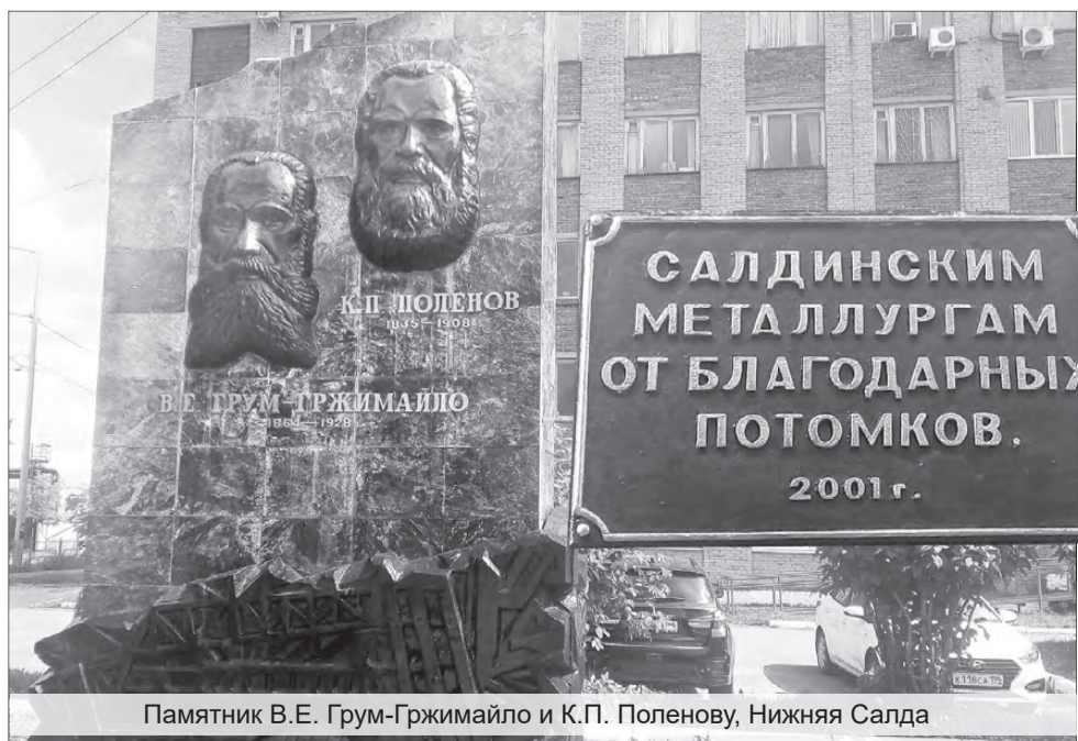
Памятник В.Е. Грум-Гржимайло и К.П. Поленову, Нижняя Салда