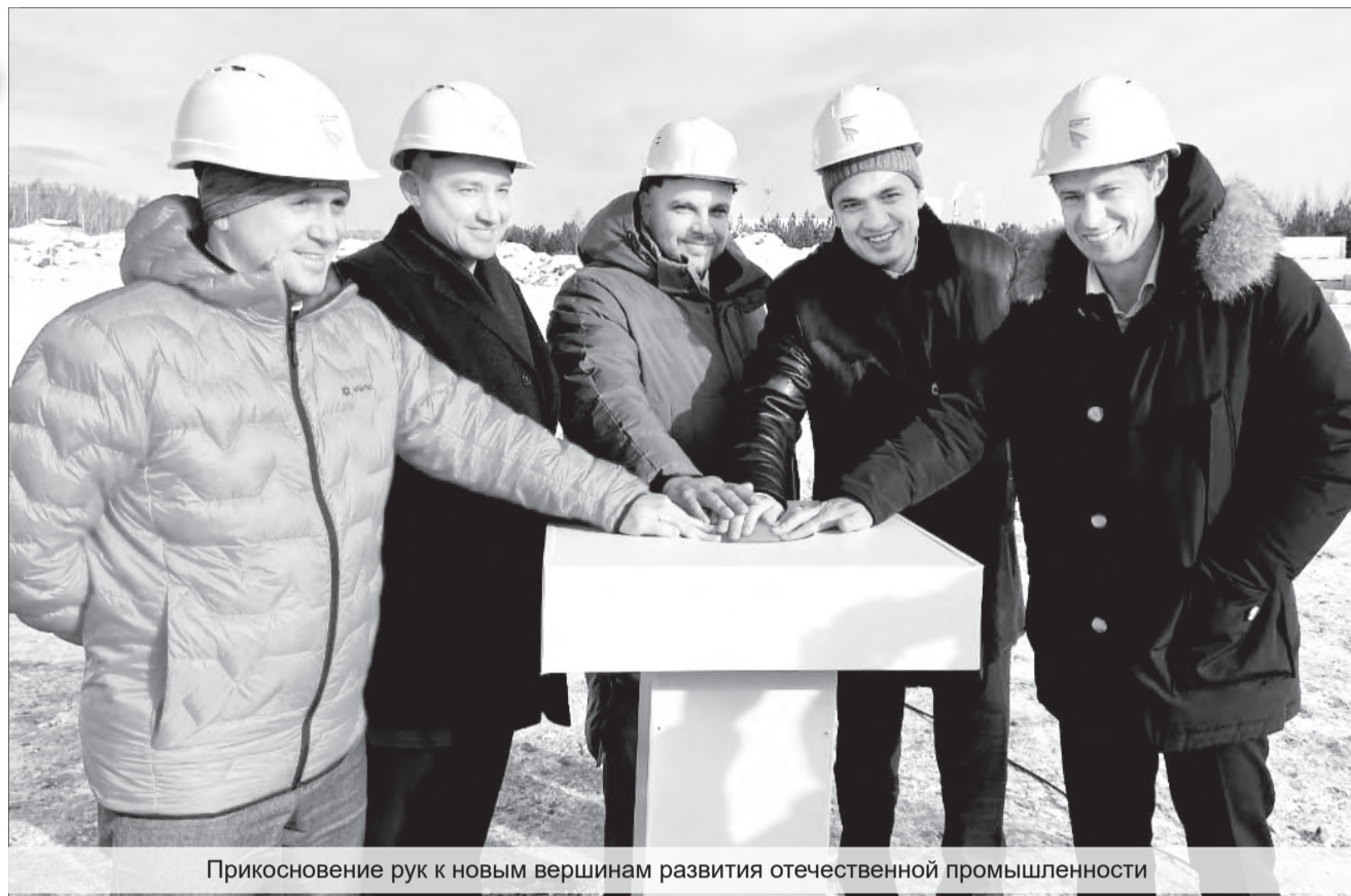
Прикосновение рук к новым вершинам развития отечественной промышленности

– По поручению губернатора Евгения Куйвашева в Свердловской области созданы максимально комфортные условия для работы с инвесторами. Важно, что ИКМЗ – наше местное предприятие, которому мы помогаем «вырасти» и в короткие сроки, уже на новой площадке,кратно увеличить объёмы производства. Этому способствуют налоговые и таможенные льготы, а также инженерная инфраструктура «Титановой долины». Появление такого предприятия ещё больше усиливает «титановую» компетенцию Верхней