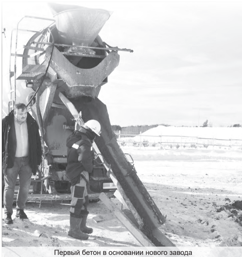
Первый бетон в основании нового завода