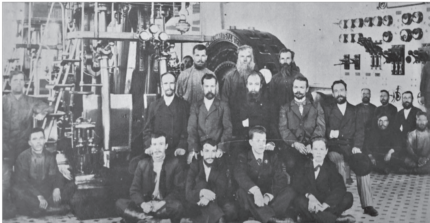
Владимир Ефимович Грум-Гржимайло и мастера Нижнесалдинского завода, конец XIX века

|| Статья посвящается светлой памяти и 160-летию со дня рождения В.Е. Грум-Гржимайло.